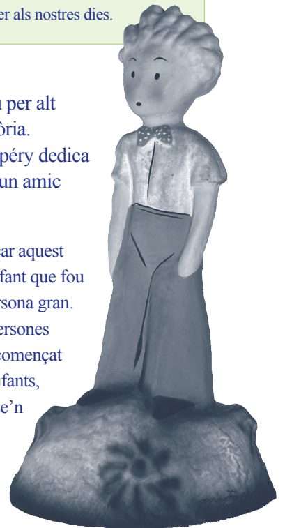
El Petit Príncep / J. S.

«Vull dedicar aquest llibre a l'infant que fou aquesta persona gran. Totes les persones grans han començat per ésser infants, però pocs se'n recorden».