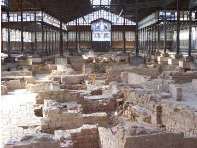
- Mercat del Born (cases del barri de la Ribera)