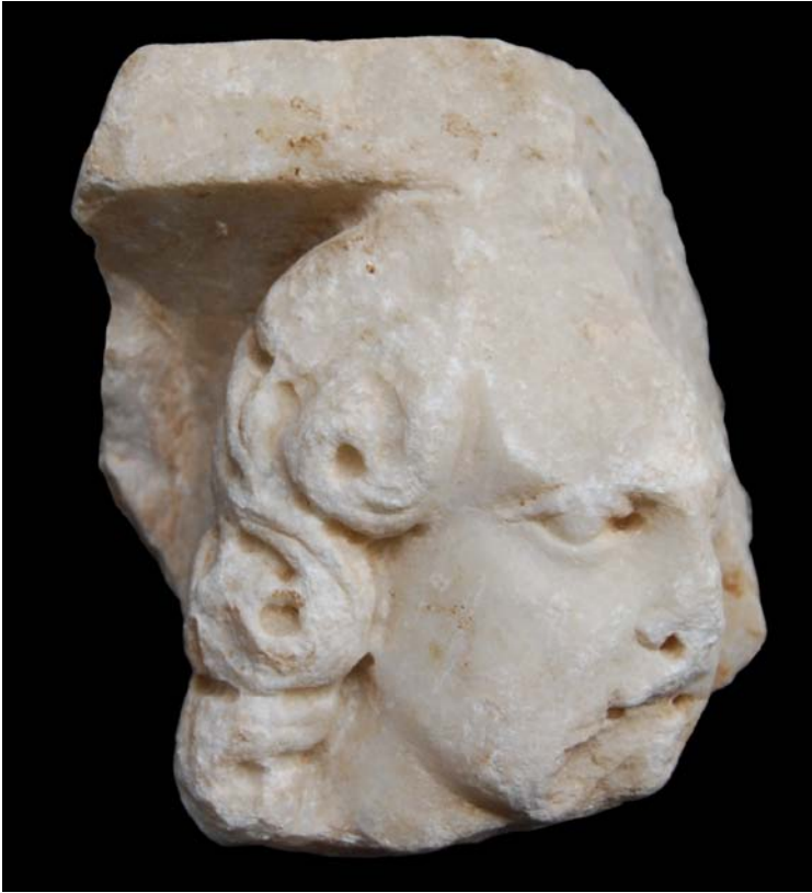
Fragment d'un sarcòfag de marbre localitzat a l'entorn de l'església dels Sants Just i Pastor a les excavacions arqueològiques de finals dels anys 90: últim terç del segle III i segle IV