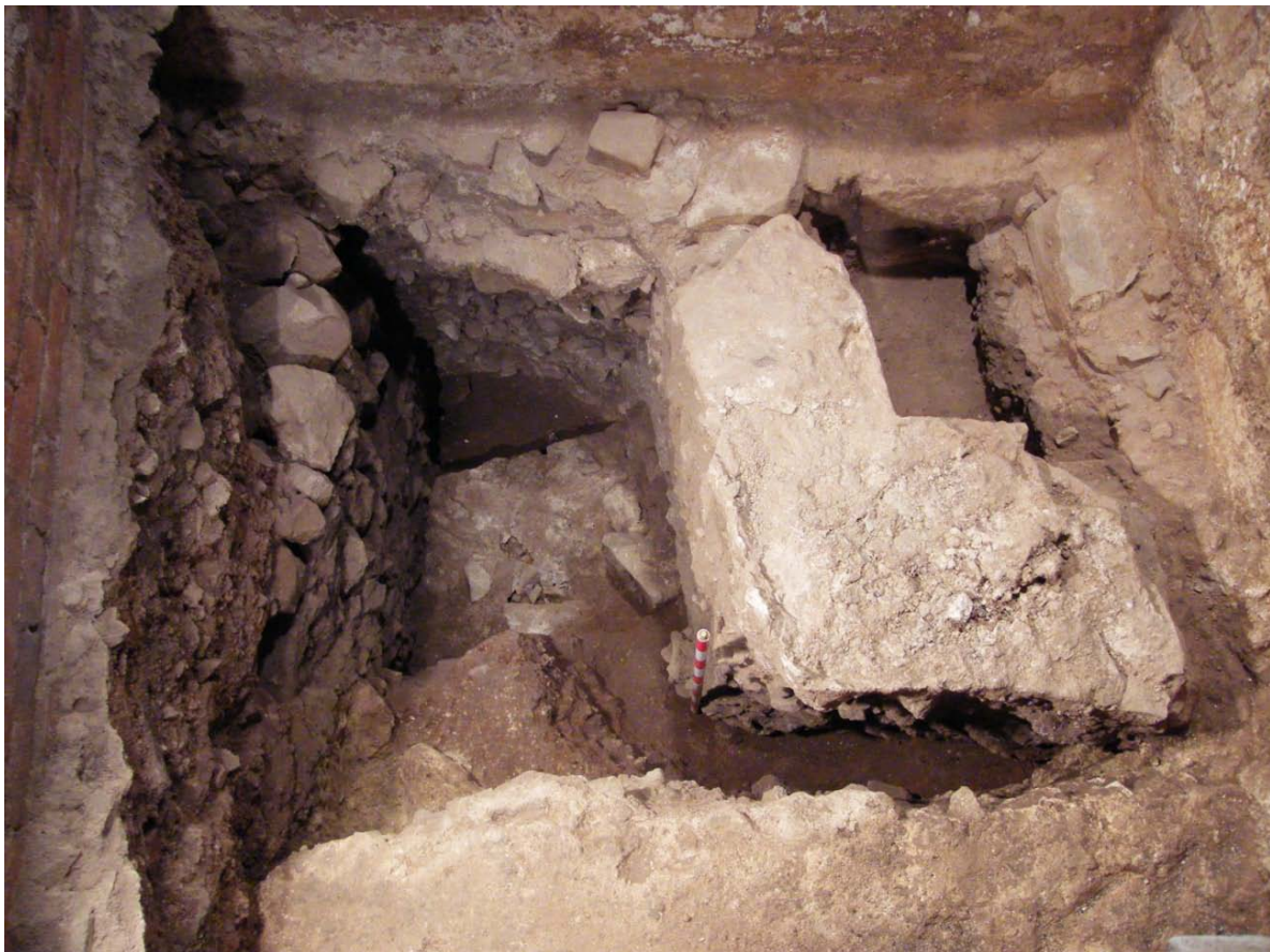
Piscina baptismal Segle VI

La presència d'una piscina baptismal s'ha de vincular a la presència d'un bisbe (a l'antiguitat tardana l'administració del baptisme estava reservada de manera exclusiva als bisbes i només es feia una vegada a l'any) però se sap que el grup episcopal de la ciutat (amb la basílica principal i el baptisteri, una església martirial, el palau i la sala de representació del bisbe, el palau del comte visigot, etc...) es localitza sota la catedral actual. Aquest grup episcopal ha estat ben estudiat i publicat i és ben conegut a l'arqueologia cristiana d'arreu.