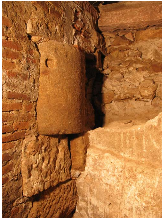
Estructures in situ de l'antiga església dels Sants Just i Pastor. Segle VI

A la historiografia de Barcelona sempre ha estat present que l'església dels Sants Just i Pastor era una de més antigues de Barcelona. L'advocació als nens Just i Pastor, martiritzats al segle IV a Complutum (Alcalà de Henares) i la relació del complutens Paulí de Nola amb Barcelona, ciutat on va ser ordenat sacerdot a l'any 393, és una dada que s'ha utilitzat per a parlar de l'origen de l'església dels Sants Just i Pastor. La documentació recull que el seu fill Cels va morir a Complutum , on va rebre sepultura al costat d'un martyrium , segurament els dels màrtirs Just i Pastor, l'advocació dels quals es va estendre a la península ibèrica en època visigoda.