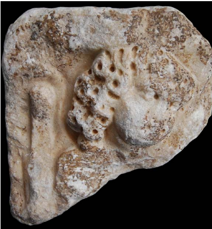
Fragment d'un sarcòfag de marbre localitzat a l'entorn de l'església dels Sants Just i Pastor a les excavacions arqueològiques de finals dels anys 90: últim terç del segle III i segle IV