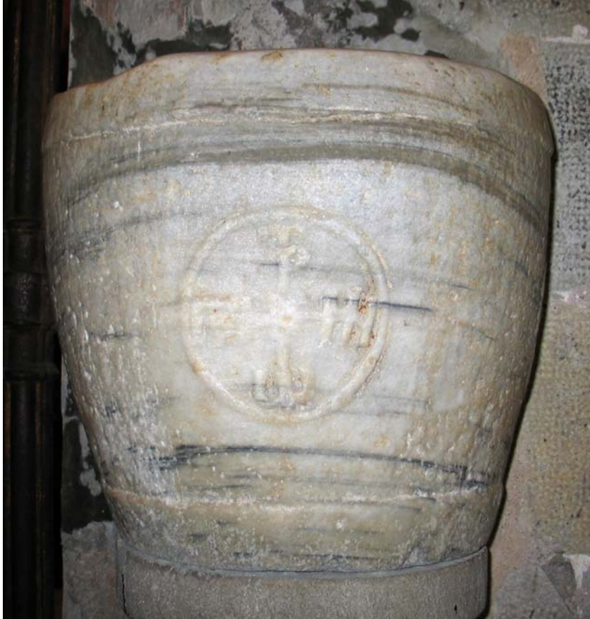
Capitell aprofitat com a pica d'aigua beneïda a l'església dels Sants Just i Pastor, segles VI-VII

D'altra banda, amb aquesta nova situació s'entén millor el creixement i l'extensió del primer grup episcopal de Barcelona (va ocupar quasi un quart de la ciutat) impulsat i propiciat pel poder oficial i per la política visigoda. També s'entenen millor algunes troballes arqueològiques de l'entorn de Sant Just i Pastor, com per exemple dos fragments de sarcòfags de marbre del Proconès que procedeixen dels tallers de Roma. Uns elements funeraris nobles destinats a personatges notables que es van poder enterrar a l'interior de la ciutat (la gent s'enterrava fora, al suburbium , únicament les elits locals podien fer-ho a l'interior), al costat de les relíquies que devia custodiar l'antiga església dels Sants Just i Pastor.