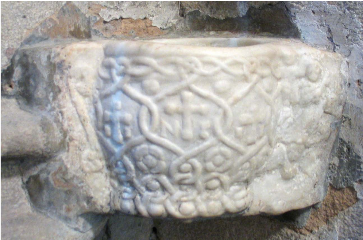
Capitell aprofitat com a pica d'aigua beneïda a l'església de Sant Just i Pastor, segles VI-VII

La tolerància i bona convivència entre arrians i catòlics es mostra també en la celebració de sínodes. Al segle VI, es van celebrar sis concilis a la Tarraconense: Tarragona al 516, Girona al 517; Lleida al 546 i a Barcelona a l'any 540; aquest es va celebrar a l'església dels Sants Just i Pastor, sent bisbe Nebridi. La presència a l'interior de l'actual església gòtica de dos capitells d'època visigoda reutilitzats com a piles d'aigua beneïda, s'han de contextualitzar en aquest nou nucli episcopal.