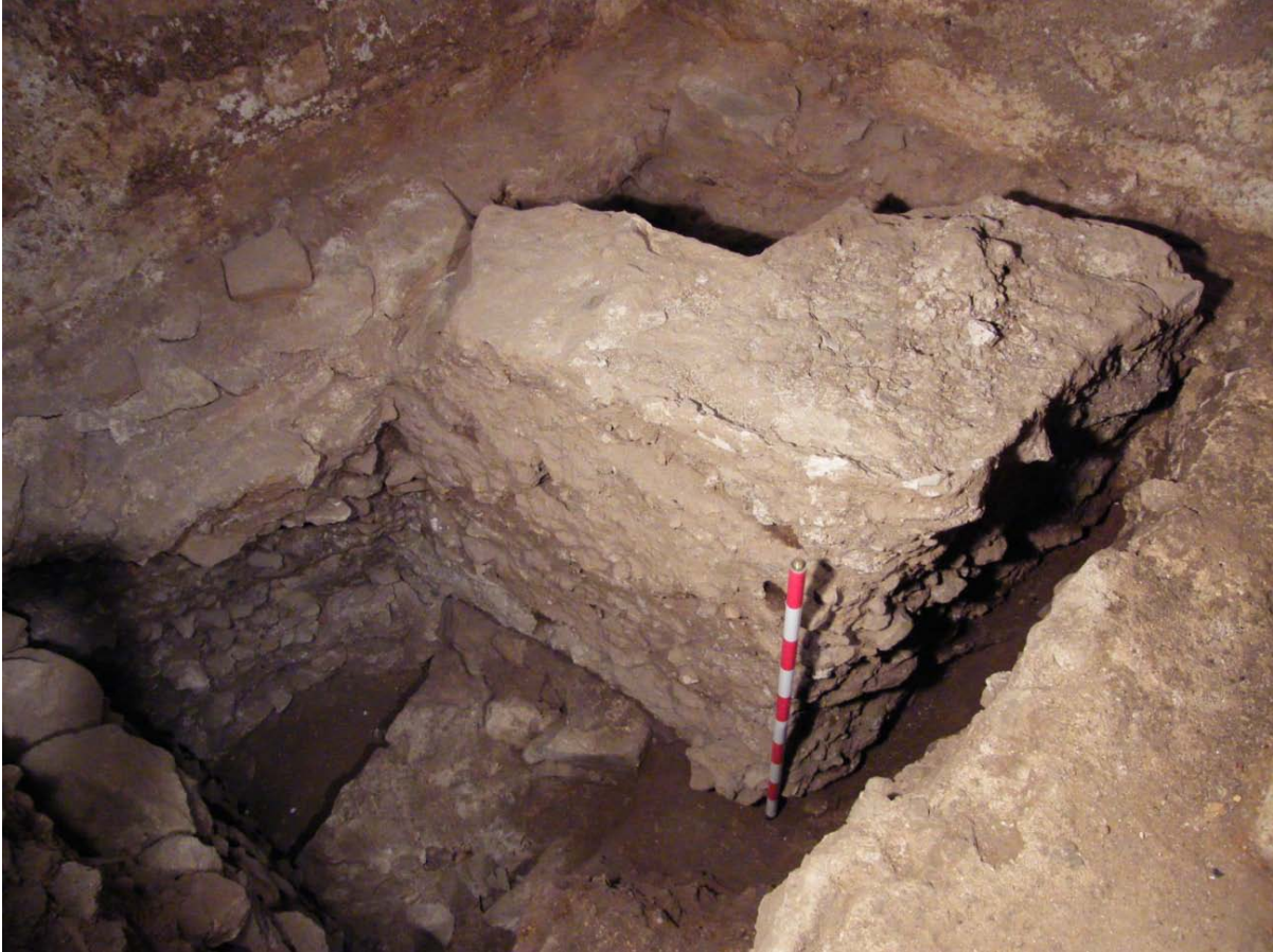
Detall dels murs de la piscina baptismal Segle VI

Cal recordar la presència dels visigots a la ciutat (que eren arrians) des de l'any 415, quan Ataülf i Gal·la Plàcida s'establiren a Barcelona. Se sap que es va donar una convivència dels nous arrians amb la població local catòlica. També hi ha constància –per la documentació escrita– que a la ciutat, a partir del període visigot va haver-hi una dualitat de culte (culte arrià i culte catòlic), per la qual cosa se sap que existien dos nuclis episcopals amb dos bisbes. S'acaba de documentar l'existència del segon grup episcopal a Barcelona. Ara es pot plantejar que quan els visigots es van instal·lar a la ciutat van “ocupar” el nucli episcopal que estava sota la catedral actual, i que els catòlics van ser “desplaçats” a sant Just a on ja hauria d'haver-hi una primera església (d'aquesta primera església encara no hi ha dades arqueològiques). D'aquesta manera i fins a l'any 589 (data final de l'arrianisme), a Sant Just i Pastor es va desenvolupar el nucli episcopal catòlic, més petit i de menor pes a la ciutat oficial, i a l'angle nord, a tocar de la muralla i sota la catedral actual es va configurar el nucli episcopal-comtal arrià i centre de poder de la ciutat visigoda.