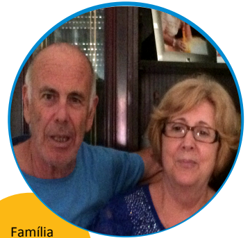
Família Guerola Arrastraria Tortosa

Estem molt contents, a més el podem acompanyar on va i viure amb ell molts moments bonics. També penso que és un do, i una alegria tenir un fill capellà".