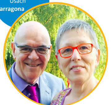
Família Mateu Usach Tarragona

Una senzilla pregària demanant vocacions al ministeri ordenat o a la vida religiosa no hauria de faltar mai, sigui en la família o en el grup de vida cristiana. És necessari demanar a l'amo dels sembrats que envii treballadors als seus camps. Estem segurs que les nostres pregàries van ser escoltades i que ho són sempre, però moltes vegades quan Déu ens allarga la mà, cal tenir la decisió d'agafar-la i de seguir el camí que ens ensenya".