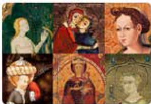
Vic Cultura i 7 més

17:34 · 28 febr. 19 · Twitter Web Client