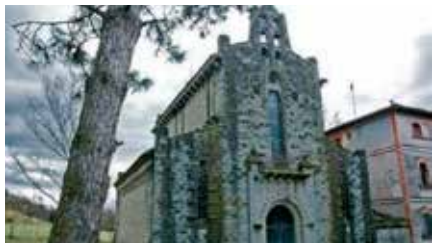
Una empresa compra l'església de la Coromina i la llogarà per actes Dv, 01/02/2019 | El 9Nou