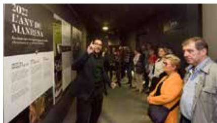
Exhaurides les places per a la visita ignasiana «Hora 20.22» Dl, 04/02/2019 | Regió 7