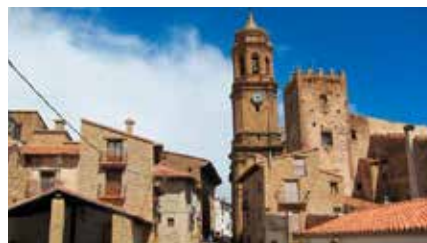
L'Església recapta 267,8 milions d'euros de l'IRPF, la xifra més alta des del 2007 Dm, 05/02/2019 | El Món