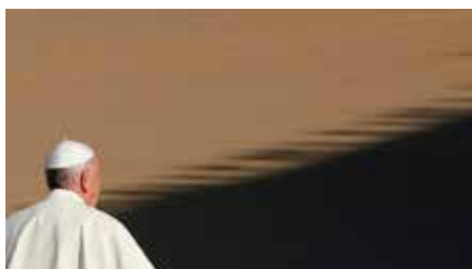
El Papa admnet abusos sexuals de sacerdots i bisbes a monges Dm, 05/02/2019 | La Vanguardia