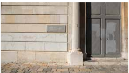
El Vaticà va investigar dos capellans de Tarragona per presumptes casos de pederàstia Dm, 05/02/2019 | Tarragona Digital