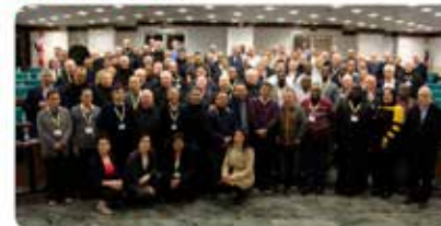
Foto de família de los participants al 69º Capítulo General de la Orden Hospitalaria de San Juan de Dios. ow.ly/IQb130nr76J