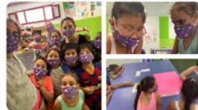
1 PES La Mina - SSJ i Mascarillas Corvi

Donem les #GRÀCIES a @AntiviralMask (Mascarillas Corvi) per la donació d'aquestes mascaretes tan maques que hem pogut regalar als infants dels grups de #Petits1 , #Petits2 , #Mitjans1 i #Mitjans2 - #barriLaMina l'heu molt més amb aquests colors i a més són reutilitzables 🥰🥰🥰❤️❤️❤️