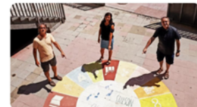
11:25 · 09 jul. 20 · Twitter for Android

L'equip coordinador #ODSVedruna preparant amb il·lusió els reptes del nou curs La realitat dels #ODS a l'aula Compromís social i mediambiental Un món més digne, més equitatiu, més sostenible GRÀCIES equips de les 36 escoles! #escolaoberta #intensament