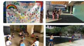
17:36 · 06 jul. 20 · Twitter Web App