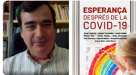
1 Llibreria Claret i 9 més