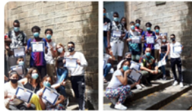
10:01 · 06 jul. 20 · Hootsuite Inc.

14 dels 15 joves del curs de PFI de cuina s'han pogut graduar tot i les adversitats de la formació a distància i la bretxa digital! Gràcies a l'equip educatiu per l'esforç dels últims mesos i enhorabona als joves pel objectius aconseguits!