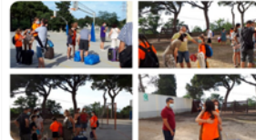
21:12 · 10 jul. 20 · Twitter for Android

Un èxit de públic i de crítica el musical que han estrenat avui per a les famílies els participants de les colònies de ball de #Laconreria i després dels triomfs arriba el moment que els artistes tornin a casa. Emoció de retrobar les famílies i emoció d'acomiarar els amics!