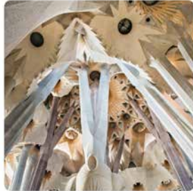
12:35 · 07 jul. 20 · Twitter Web App

La influència de la natura en l'obra de Gaudí es veu clarament a les voltes de l'interior de la Sagrada Família.