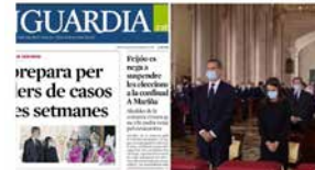
8:52 · 07 jul. 20 · Twitter for iPhone