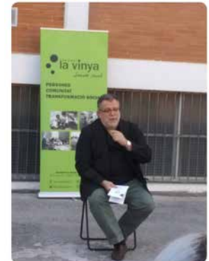
18:10 · 09 jul. 20 · Twitter Web App