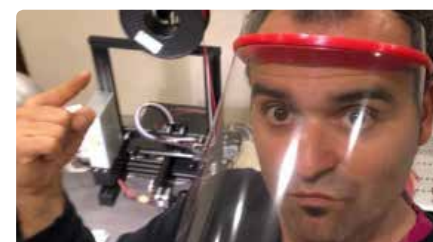
L'Escola Diocesana de Navàs fabrica viseres amb impressores 3D per al personal sanitari DC, 25/03/2020 | REGIÓ 7