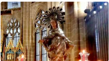
L'himne de la Cinta s'escolta cada dia a la Plaça Alfons de Tortosa DJ, 26/03/2020 | SETMANI L'EBRE