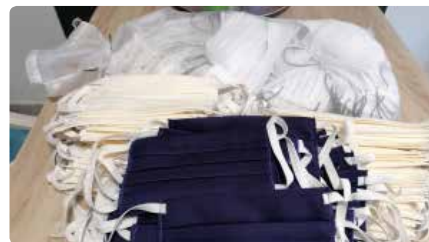
Les confraries de Mataró fan centenars de mascaretes amb la roba de les seves túniques DC, 25/03/2020 | CAPGRÒS