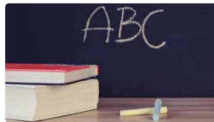
L'escola concertada demana ajuda econòmica a la Generalitat pel coronavirus DJ, 26/03/2020 | 3/24