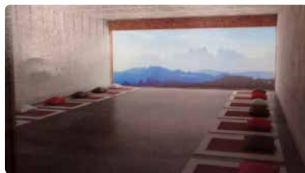
La Cova ho té tot a punt per construir l'oratori soterrat DJ, 26/03/2020 | REGIÓ 7