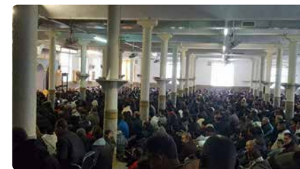
Resar a casa i parlar per telèfon: els musulmans de Manresa enyoren la vida social de la mesquita DV, 27/03/2020 | NACIÓ DIGITAL