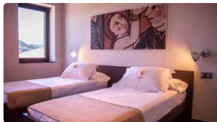
El Seminari acollirà pacients per descongestionar l'Hospital de Vic DM, 24/03/2020 | EL 9 NOU