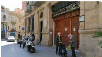
La mesquita del Clot, indústria veïnal de mascaretes artesanes DM, 24/03/2020 | TOT BARCELONA