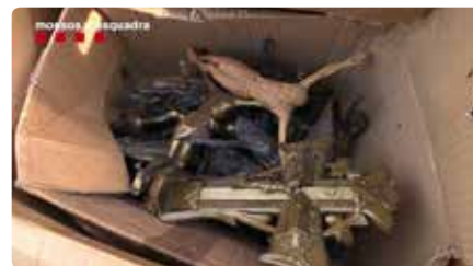
Detenen un excapellà acusat d'estafar gent gran al Bages Dv, 20/12/2019 | 3/24