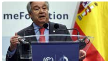
El secretari general de l'ONU: Francisc ens ajuda a promoure la pau Dl, 16/12/2019 | VATICAN NEWS