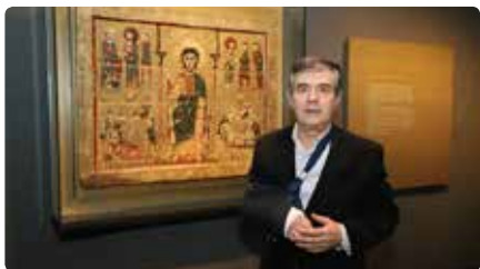
La sentència que obliga a entregar l'art a Aragó no es pot executar Dg, 15/12/2019 | SEGRE