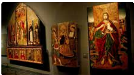
El Govern promou un conflicte de jurisdicció amb requeriment previ d'inhibició per mantenir els béns de la Franja Dc, 18/12/2019 | LA MAÑANA