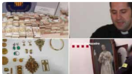
El bisbat de Vic estudia ser acusació particular contra l'exrector de Sant Vicenç Dv, 20/12/2019 | REGIÓ 7