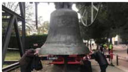
La campana olímpica de Barcelona torna a sonar Dj, 19/12/2019 | LA VANGUARDIA