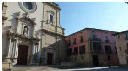
Mor mossèn Fèlix Guàrdia, exnúmero dos del bisbat de Vic molt vinculat a Manresa Dg, 15/12/2019 | REGIÓ 7