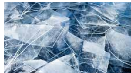
L'Església expressa decepció pel fracàs de la Cimera de Klima, però veu esperança Dm, 17/12/2019 | LA VANGUARDIA