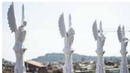
Etiquetes de vi i els capitells de la Sagrada Família: els dissenys nascuts a Palo Alto DL, 25/11/2019 | ARA