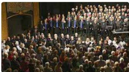
Dotze corals posen el cor en un concert en benefici de Càritas Manresa DM, 26/11/2019 | REGIÓ 7