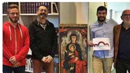
La biblioteca de Gironella vol ser el punt de referència de l'art romànic de Catalunya DJ, 28/11/2019 | REGIÓ 7