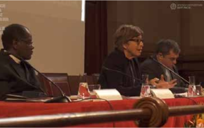
Ateneu Universitari Sant Pacià. Facultat de Teologia de Catalunya.