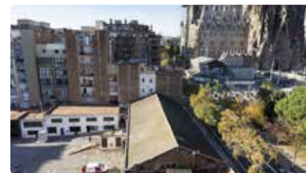
Veïns de la Sagrada Família rebutgen l'escalinata que vol construir el temple DV, 29/11/2019 | EL PAÍS