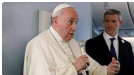
El papa inclou Espanya entre els "països que tenen problemes" i apel·la al diàleg DC, 27/11/2019 | 3/24