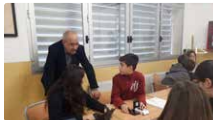
Una entitat musulmana denuncia Bargalló al TSJC per delictes d'odi i prevaricació DM, 26/11/2019 | LA VANGUARDIA