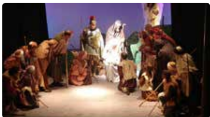
Música en viu pel centenari dels Pastorets d'Olot de l'Orfeó DL, 25/11/2019