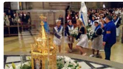
Lleida rep les relíquies de Bernadette de Lourdes DM, 26/11/2019 | LA MAÑANA