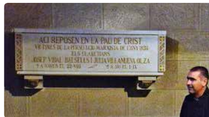
Solsona col·locarà un altar en honor de dos beats claretians Dm, 22/10/2019 | Regió 7