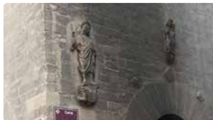
Els disturbis a Lleida causen danys a la façana d'una capella històrica Dl, 21/10/2019 | La Vanguardia