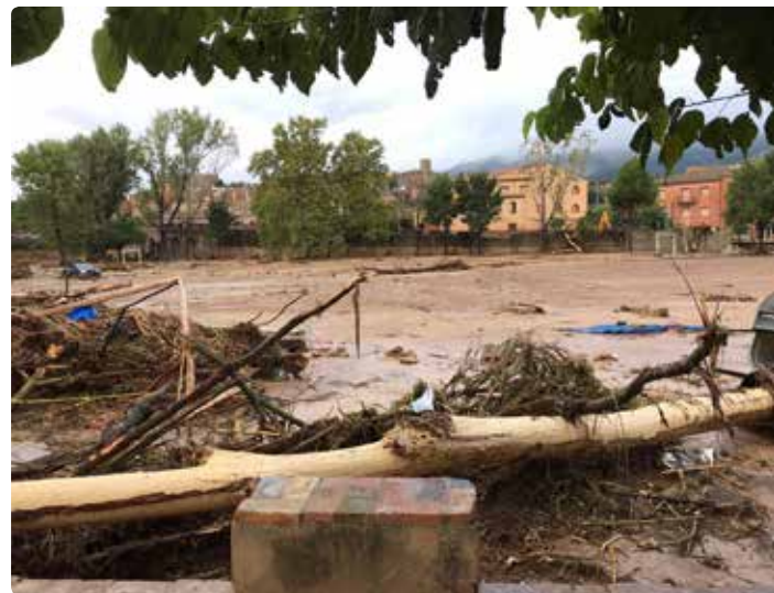
L'Escola de la Mare de Déu de la Serra, de Montblanc | Simó Gras.

També al Monestir de Poblet han quedat temporalment sense aigua, llum, telèfon ni internet. I han lamentat la situació catastròfica de l'entorn del monestir i d'altres punts de la comarca.