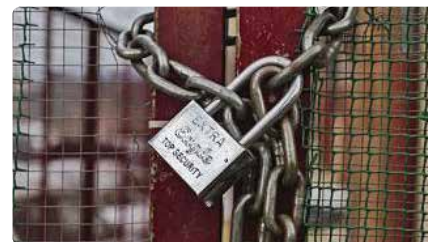
El programa per a gent sense llar de Càritas Diocesana incorpora 28 persones a Figueres Dj, 24/10/2019 | Diari de Girona