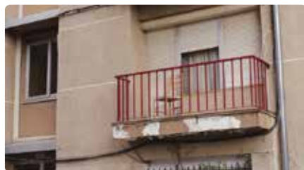
Càritas de Girona demana que li cedeixin pisos buits Dj, 24/10/2019 | El Punt Avui