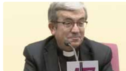
El portaveu dels bisbes espanyols defensa la Constitució Dc, 23/10/20109 | Europa Press