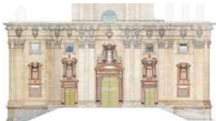
El Bisbat invertirà 600.000 euros en restaurar la façana barroca de la catedral de Tortosa Dj, 24/10/2019 | Ebre Digital