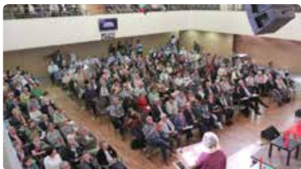
Pregària pels encausats a l'Església evangèlica de Terrassa Dg, 20/10/2019