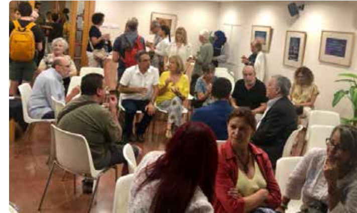
Nit de les Religions 2019 al local Bahá'í de Barcelona.

Bahá'u'lláh va escriure més de 100 volums. Hi ha dos llibres en particular que són molt importants, El llibre de lleis , un compendi de tots els ensenyaments de Bahá'u'lláh, i un altre que es titula El llibre de la certesa , que són explicacions que dona Bahá'u'lláh sobre la religió, com es produeix la revelació, perquè la gent quan ve un nou missatger no el reconeix. Hi ha també moltes altres obres, de místics, com Les paraules ocultes , que és una sèrie d'aforismes, frases curtes que amaguen tota la mística de les religions.