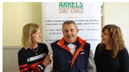
Els usuaris sense sostre d'Arrels Sant Ignasi volen 'donar la cara' Dj, 24/10/2019 | La Mañana