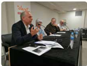
19:32 · 19 set. 19 des de Llibreria Claret · Twitter for Android