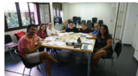
9:37 · 16 set. 19 · Twitter Web App

@FUNDACIOROCAIPI @caritasbcn @OHSanJuandeDios