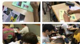
La Salle Catalunya 12:58 · 20 set. 19 · Twitter Web App

A #Religió de 4t ESO els alumnes treballen a partir de fotografies pròpies el sentit de la vida #reflexionem #imagine m #pensem #creem #lasallelaSeu #imagina