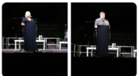
20:49 · 14 set. 19 · Twitter for Android

Enhorabona a la @Epiacalella pels seus 200 anys! Ho celebrem amb una gran festa!