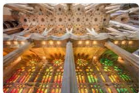
15:29 · 17 set. 19 · Twitter Web App