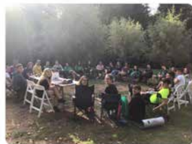
15:39 · 14 set. 19 · Twitter for iPhone

Els monitors/es del Cau Arrels ja estem preparant el nou curs a Sant Aniol de Finestres.