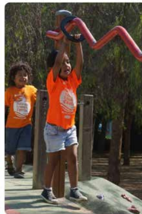
13:24 · 20 set. 19 · Twitter Web App