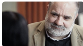
11:56 · 18 set. 19 · Twitter Web App