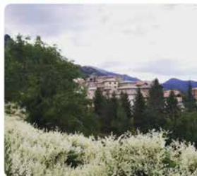
13:41 · 17 set. 19 · Twitter Web App

Si busqueu una casa a la natura! mireu aquest Instagram! És la casa Pare Coll! us encantarà! instagram.com/casaparecoll/