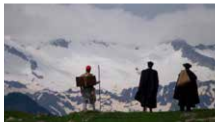
La pel·lícula documental 'Maleïda 1882' recrea la gran travessa de Jacint Verdaguer a l'Aneto Dm, 02/07/2019 | VILAWEB