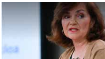
Queixa formal al Vaticà del govern espanyol per les opinions del nunci sobre l'exhumació de Franco Dm, 02/07/2019 | EL NACIONAL