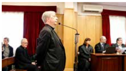
La Generalitat presenta documentació nova al judici per l'art de Barbastre Dc, 03/07/2019 | SEGRE