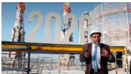
L'impressionant especial de la revista 'Time' dedicat a la Sagrada Família Ds, 29/06/2019 | EL NACIONAL