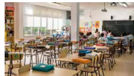
La llibertat en l'educació, un dret inalterable Dl, 01/07/2019 | ARA