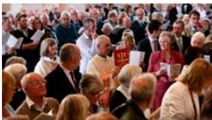
No publicaràs tuits impurs i respectaràs els drets d'autor Dm, 02/07/2019 | EL PAÍS