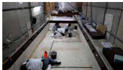
La Unesco declara fora de perill la basílica de la Nativitat de Betlem Dc, 03/07/2019 | EL PAÍS