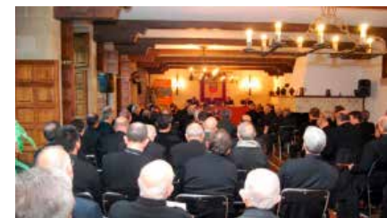
La principal obra de l'Opus Dei s'inspira en el manual d'un jesuïta del segle XVIII Dv, 05/07/2019 | LA VANGUARDIA