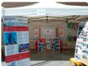
10:55 · 29 maig 19 · Twitter for Android

Ja muntada la carpa de PES SALESIANS La Mina per a la Mostra entitats, Setmana cultural de La Mina.