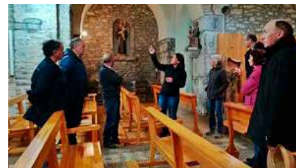
La Cerdanya impulsa un pla per obrir al públic les esglésies més singulars Dv, 24/05/2019 | Regió 7