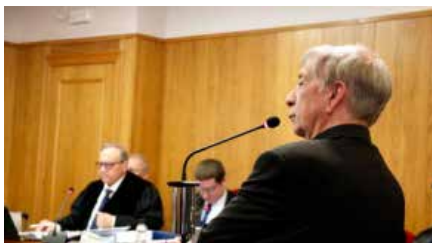
El bisbe de Lleida lamenta "la imatge que donem de 2 diòcesis enfrontades" Dl, 27/05/2019 | Segre