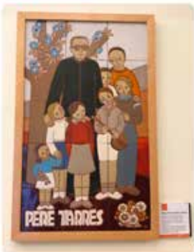
8:45 · 30 maig 19 · Hoetsuite Inc

Ceràmica de les germanes del Monestir de les Benedictines de @PNMontserrat