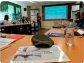
8:57 · 30 maig 19 · Twitter Web Client

Qualitat, #innovació, eficiència i COR vol dir... oportunitats. @ESADEAlumni i @ceobrialles ho han somiat junts! Fem camí plegats. #obrasocialmarista #maristes @ESADE