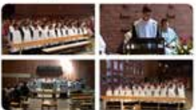
15:20 · 30 maig 19 des de Hegberg, Deutschland · Twitter for iPad

En la solemnitat de l'Ascensió, ha estat bonic participar en la celebració litúrgica de la comunitat que ens ha acollit a Nümburg. Ens separa la distància però ens uneix la mateixa fe. Gràcies per l'acollida!