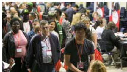
'Feina amb Cor' de Càritas Barcelona ha ajudat a trobar feina a 4.000 persones des del 2013 Dl, 27/05/2019 | El PuntAvui