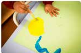
10:34 · 30 maig 19 · TweetDeck

Proporcionar una educació que va més enllà de l'acadèmica, és un dels nostres propòsits. Per això, promovem la creativitat, l'expressió i la sociabilitat, uns valors que fan esdevenir dels nostres alumnes, persones compromeses i amb sentit crític!