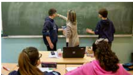
El Govern aprova la llei perquè les escoles concertades que vulguin passin a ser públiques Dc, 29/05/2019 | ARA