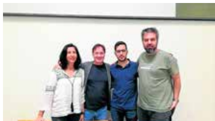
Arrels Lleida denuncia la falta d'ajuts als temporers Dj, 30/05/2019 | Segre