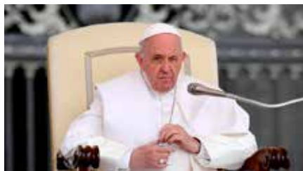
El Papa nomena per primera vegada a dones a la secretaria del Sínode Ds, 25/05/2019 | La Vanguardia