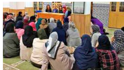
El CAP de Manresa aconsella dones musulmanes sobre com fer el ramadà de forma saludable Dg, 26/05/2019 | Regió 7