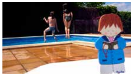
Les comunions es mantenen davant la caiguda lliure dels casaments Dg, 26/05/2019 | El Periódico