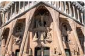
9:28 · 29 maig 19 · Twitter Web Client

#Gaudí va dir que la façana de la Passió havia de ser «dura, pelada, com feta d'ossos» i va deixar molt ben definit com havia de ser, tant des del punt de vista arquitectònic com de distribució i continguts dels grups escolars.