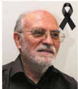
19:28 · 27 maig 19 · Twitter for Android

Lamentem comunicar-vos la mort del Gmà. Antoni Vallejo, qui va formar part de la nostra comunitat educativa des de l'any 1969 fins el 1980. Preguem pel seu etern descans i demanem al Senyor que l'aculli al seu costat. ACS