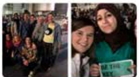
8:14 · 24 maig 19 · Twitter for iPhone

Tonight's #iftar in our #Neighborhood #raval in #Barcelona