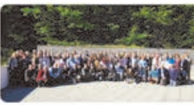
Foto de família dels participants al #FòrumProvincial #marista. Avui, dia de recopilar recomanacions, encaraades a ser treballades al #CapitolProvincial de l'estiu. Somiem i imaginem el futur plegats!