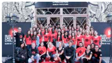
Lestonnac de TGN competeix per desenvolupar un projecte a Silicon Valley Dm, 14/05/2019 | Diari de Tarragona