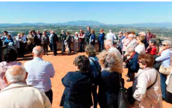
Visita al Castell de Subirats en la 48a Jornada Nacional del moviment. Sant Sadurní d'Anoia.