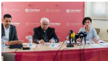
Càritas Girona detecta més famílies acollides per altres o que ocupen cases Dc, 15/05/2019 | Diari de Girona