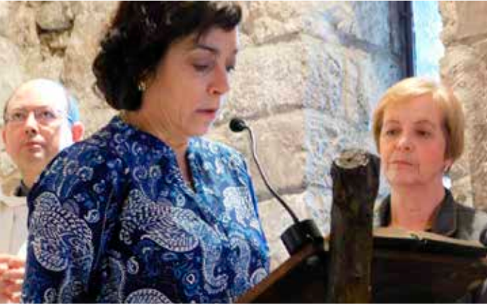
Eucaristia de la 48a Jornada Nacional del moviment. Sant Sadurní d'Anoia.