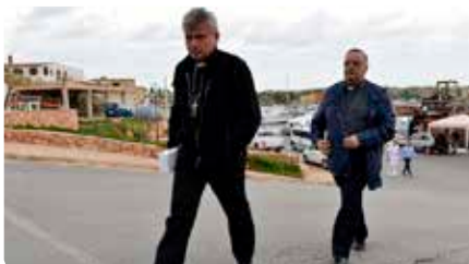
Un cardenal trenca un precinte policial per tornar la llum a un edifici ocupat per 450 sensesostre Dl, 13/05/2019 | ARA