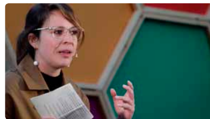
Els comuns anuncien en campanya que la Sagrada Família pagarà 4,5 milions per la llicència d'obres Dv, 17/05/2019 | Nació Digital