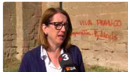
Esborrar les pintades feixistes pot agreujar l'estat del monestir de Balaguer Dm, 14/05/2019 | 324.CAT