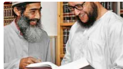
Els musulmans surten al carrer per compartir el trencament del dejuni a Reus Dc, 15/05/2019 | Diari de Tarragona