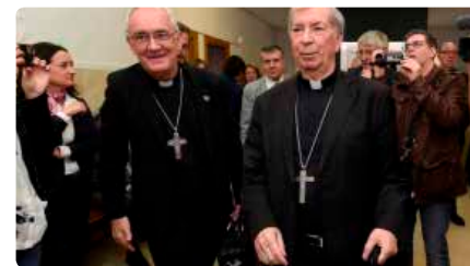
Lleida defensa i constata la propietat de 83 de les 111 obres que exigeix Aragó Dv, 17/05/2019 | Segre