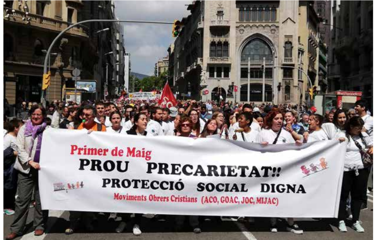
Manifestació a Barcelona amb motiu de l'1 de maig.

relles que fan relleus a casa perquè tenen horaris incompatibles. "Els és impossible trobar-se i sortir que ja tenen els nens ja grandets!", apunta.