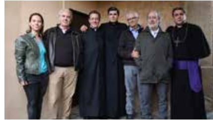
Acaba el rodatge de la pel·lícula per a televisió 'L'enigma Verdaguer', coproduïda per TV3 Dg, 07/04/2019