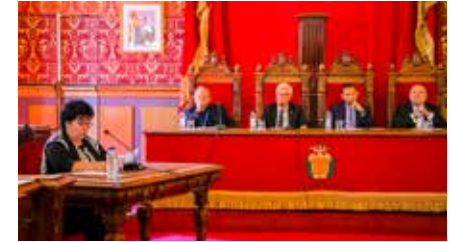
Arquebisbe Pujol: “Demano perdó si les meves paraules han ofès a algú” Dl, 08/04/2019 | Diari de Tarragona