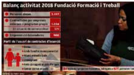
Formació i Treball, de Càritas, va ajudar un miler de persones a trobar feina el 2018 Dc, 10/04/2019 | El PuntAvui