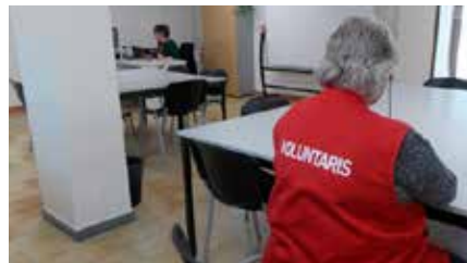
Un 53 % dels refugiats que ha acollit la Llar Sant Joan de Déu provenen de Síria i Veneçuela Dc, 10/04/2019 | Regió 7