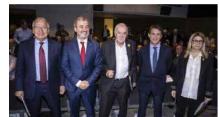
Els alcaldables per Barcelona, excepte Collboni i Bou, partidaris d'una gran mesquita a la ciutat Dj, 11/04/2019 | La Vanguardia