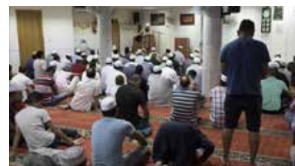
La comunitat musulmana demandarà Educació si no garanteix classes d'islam en horari lectiu Dl, 08/04/2019 | El Periódico