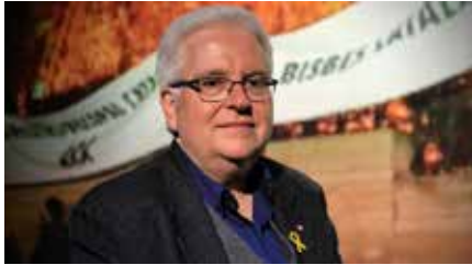
“Volem bisbes formats en la tradició catalana, la Tarraconense” Ds, 06/04/2019 | El PuntAvui