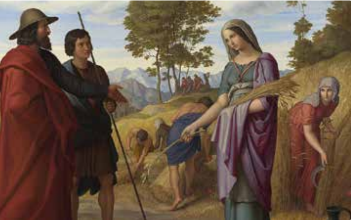
Rut al camp de Booz | Julius Schnorr von Carolsfeld.