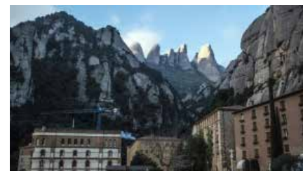
Miquel Calsina: "És bo que des d'un àmbit eclesial es puguin plantejar debats amb una reflexió més tranquil·la" Dv, 15/03/2019 | Ara