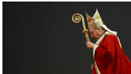
El cardenal Pell condemnat a sis anys per abusos sexuals Dj, 14/03/2019 | Vatican Insider