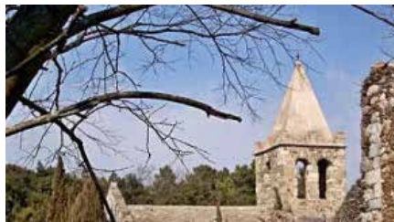
Sant Julià i el Bisbat de Girona acorden nous usos per a l'església dels Sants Metges Dc, 13/03/2019 | Diari De Girona