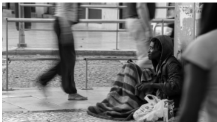
L'Església convida els cristians a votar als partits que estiguin en favor dels més empobrits Dij, 14/3/2019 | La Vanguardia