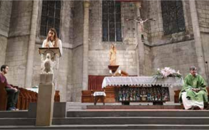
Basílica de Santa Maria de Vilafranca.