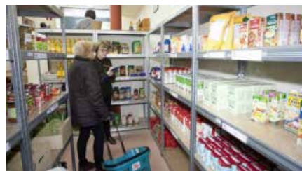
Campanya d'aliments extraordinària a Càritas parroquial de Sant Pau de Tarragona Dg, 10/03/2019 | Diari de Tarragona