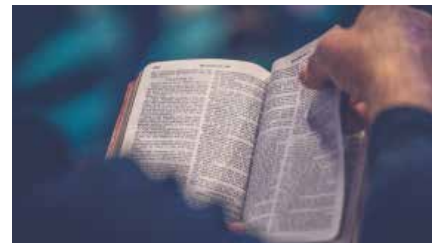
L'Església espanyola va ordenar a 135 nous sacerdots aquest 2018, un 24% més que el 2017, però cauen un 4,8% els seminaristes Dm, 12/03/2019 | La Vanguardia