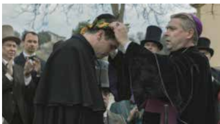
Comença el rodatge de L'enigma Verdaguer, un film dedicat a la vida i obra del poeta Dil, 11/03/2019 | Vilaweb