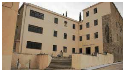
La reobertura dels «josepets» il·lusiona els tortosins Dg, 10/03/2019 | Diari de Tarragona