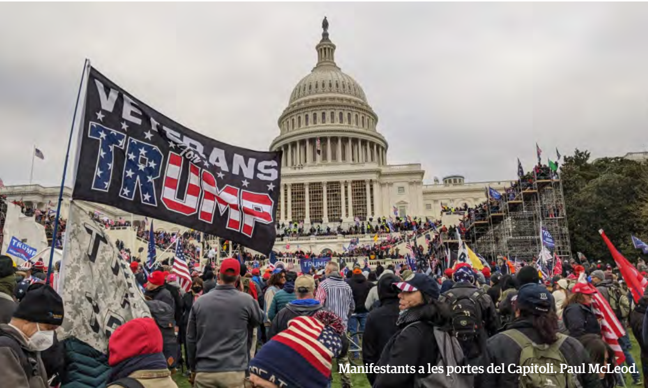
Manifestants a les portes del Capitoli. Paul McLeod.