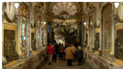
Acord per promocionar la Cova de Manresa i el Camí Ignasià Dc, 23/12/2020 | REGIÓ 7