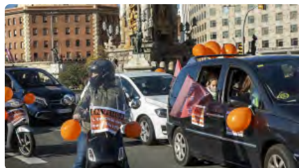
Marxes lentes de cotxes contra la llei Celaà Dl, 21/12/2020 | EL PUNT AVUI