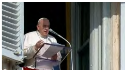
El papa Francesc carrega contra l'excessiu consumisme per Nadal Dl, 21/12/2020 | LA VANGUARDIA