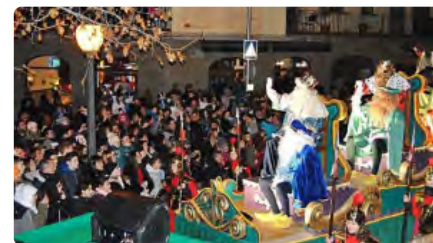
Puigcerdà organitza una recepció dels tres Reis sota comanda a la web Dj, 24/12/2020 | REGIÓ 7