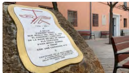
Familiars dels avis de Tremp s'organitzen: "Si no hi ha explicacions, presentarem una denúncia" Dl, 21/12/2020 | NACIÓ DIGITAL