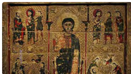
El Museu de Lleida presentarà al·legacions al trasllat de les obres de la Franja Dc, 23/12/2020 | ARA