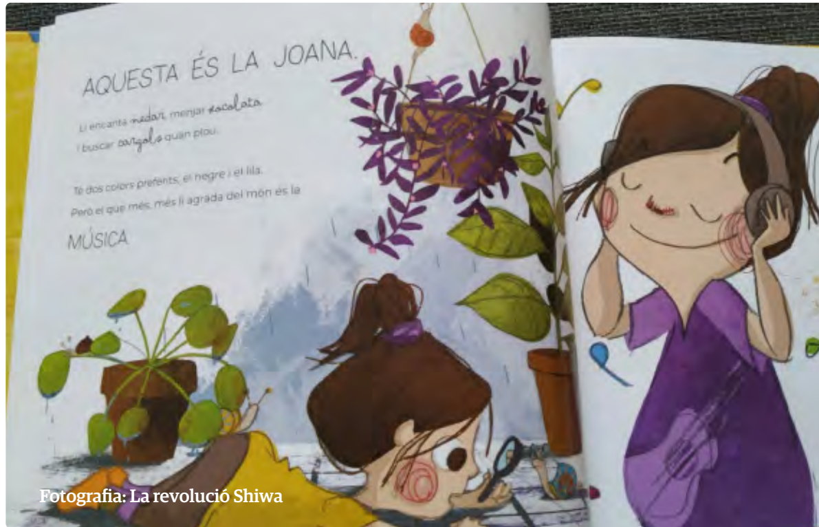
Fotografia: La revolució Shiwa

La veritat és que no coneixem cap altra manera d'entendre la vida que ens doni un consol i una esperança tan grans com la fe en Crist. La Bíblia està plena del testimoni de persones de