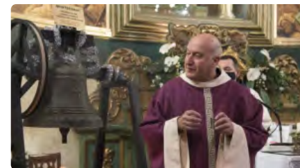
El santuari de Joncadella ja pot anunciar les misses a toc de campana Dl, 21/12/2020 | REGIÓ 7