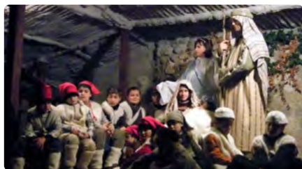
La 35a edició del Pessebre Vivent de Jesús es veurà en format telemàtic Dc, 23/12/2020 | SETMANARI L'EBRE