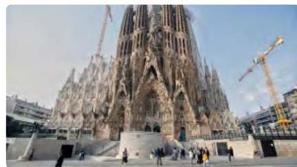
La Sagrada Família renegocia amb l'Ajuntament el pagament de les compensacions a la ciutat DV, 18/12/2020 | EL PAÍS