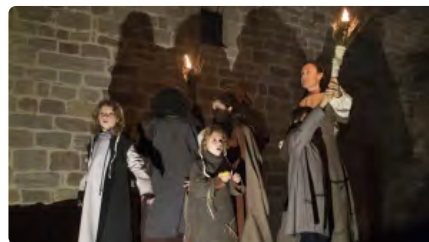
Món Sant Benet suspèn la tercera edició del pessebre vivent al monestir DM, 15/12/2020 | REGIÓ 7