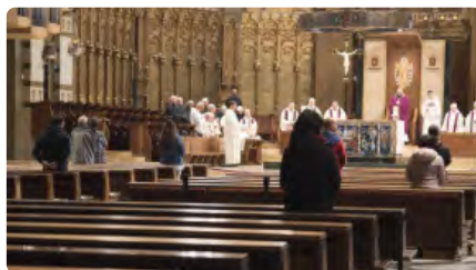
Montserrat ja té exhaurida la seva capacitat per a les litúrgies de Nadal DC, 16/12/2020 | REGIÓ 7