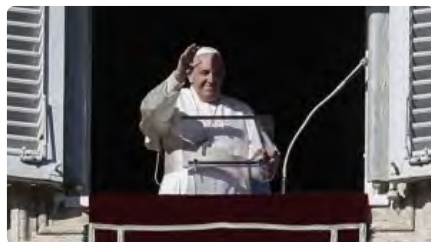
El Papa critica els cristians que tenen "cara de funeral" DL, 14/12/2020 | LA VANGUARDIA