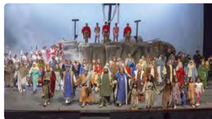
La Passió de Cervera perilla de nou per l'aforament en assajos DC, 16/12/2020 | SEGRE