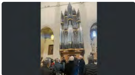
Valls posa al descobert el seu espectacular orgue DL, 14/12/2020 | DIARI DE TARRAGONA