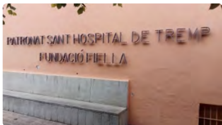
L'arquebisbe d'Urgell envia un missatge als afectats per la crisi sanitària de Tremp DM, 15/12/2020 | BISBAT D'URGELL