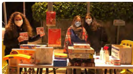
Joves de Sant Fruitós del Bages recullen mig miler de joguines per Càritas DM, 8/12/2020 | REGIÓ 7