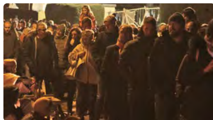
Suspès el pessebre vivent del Pont Llarg de Manresa per la covid-19 DJ, 10/12/2020 | Regió 7