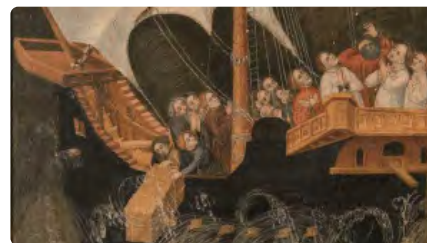
A subhasta una altra taula gòtica de la catedral de Barcelona DJ, 10/12/2020 | EL PAÍS