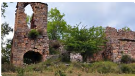
L'església de Santa Maria de Sarroqueta, al Pont, entra a la llista vermella de Patrimoni DG, 06/12/2020 | La Manyana