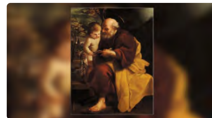
El Papa Francesc convoca un "Any de Sant Josep" DC, 9/12/2020 | VATICAN NEWS