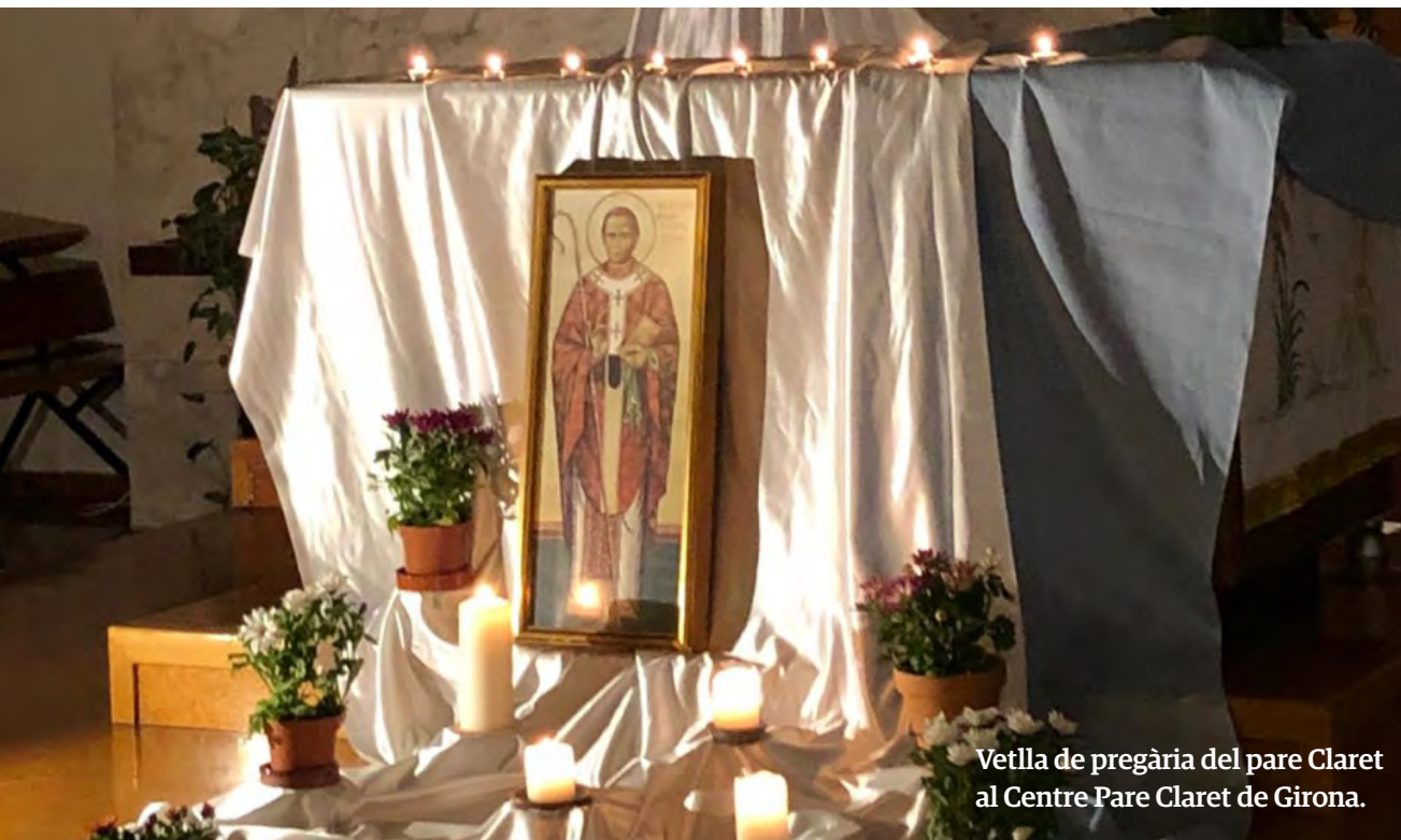
Vetlla de pregària del pare Claret al Centre Pare Claret de Girona.