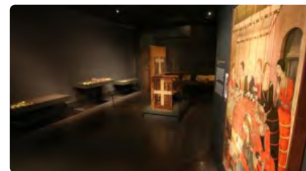
Liciten la nova àrea del gòtic del Museu de Lleida DJ, 10/12/2020 | SEGRE