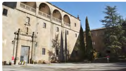
El Miracle adaptarà el seu exterior per fer-lo més accessible DM, 8/12/2020 | REGIÓ 7