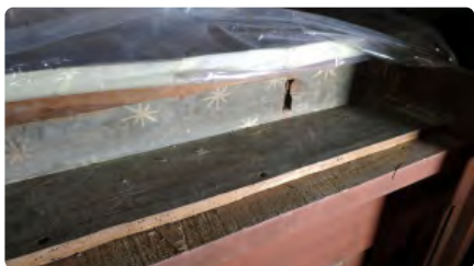
Descobreixen fragments d'un retaule del segle XV o XVI durant la restauració de l'orgue de Solsona DJ, 10/12/2020 | EL PUNT AVUI