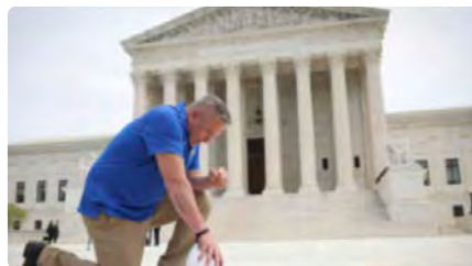
El Suprem dels EUA amplia els drets religiosos en emparar que funcionaris puguin pregar en públic DM, 28/06/2022 | EL PAÍS