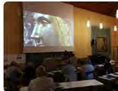
12:30 · 27 jun. 22 · Hootsuite Inc.

Trobades d'Animadors de Cant per a la Litúrgia 2022: aprendre i fer música junts, la seva base pedagògica - Les Trobades d'Animadors de Cant per a la Litúr... #Montserrat #Cursets #Notícies #ActivitatsMontserrat abadiamontserrat.cat/trobades-anima... Traducció: Tweet