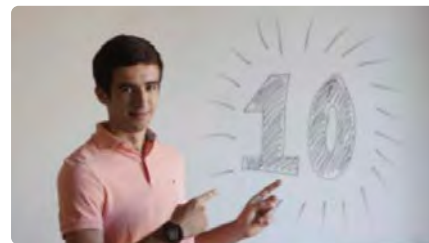
Un alumne de l'Escola Pia i una estudiant dels Salesians treuen un 10 a la selectivitat DJ, 30/06/2022 | EL PERIÓDICO