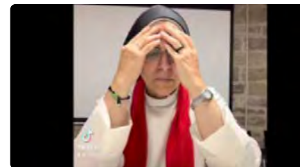
TikTok bloqueja Sor Lucía per mostrar imatges de la tragèdia de Melilla DM, 28/06/2022 | REGIÓ 7