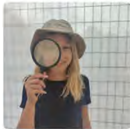
13:15 · 01 jul. 22 · Metricool

Acabem la 1a setmana dels #casalsdestiuFEDAC. Els #casals són una oportunitat d'educaciónenlleure i també un servei de les #escolesFEDAC per facilitar la conciliació familiar i laboral de les famílies. Quina ha estat l'activitat preferida dels vostres fills aquests dies? Traducció: Tweet