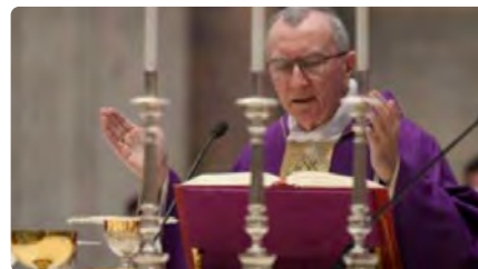
Pietro Parolin visitarà República Democràtica del Congo i Sudan del Sud en substitució del Papa DM, 28/06/2022 | VATICAN NEWS