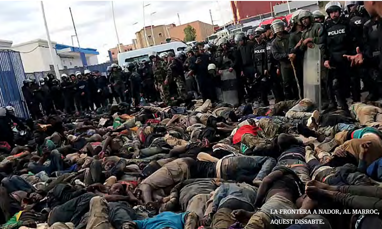
LA FRONTERA A NADOR, AL MARROC, AQUEST DISSABTE.