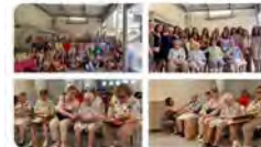
17:51 · 30 jun. 22 · Twitter for iPhone

Avui hem fet un acte d'homenatge a les Germanes #Vedruna de #Girona Aquest estiu la Comunitat tanca i les darreres Germanes deixen Girona. La vida a l'escola continua però us trobarem molt a faltar, seguirem el vostre camí ❤️ MOLTÍSSIMES GRÀCIES PER TOT! #decididament @VedrunaCat Traducció: Tweet