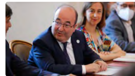
Cultura descarta fixar un límit als preus d'entrades a esglésies i catedrals DV, 01/07/2022 | EL PERIÓDICO