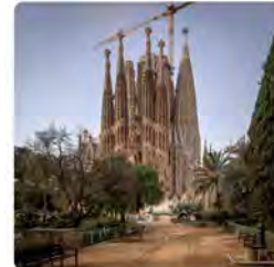
12:48 · 01 jul. 22 · Twitter Web App

La Sagrada Família @sagradafamilia El dia 3 de juliol del 2022, entre les 22 i les 24 h, la façana del Naixement de la Sagrada Família s'il·lumina de groc amb motiu del Dia Mundial de la Síndrome de Rubinstein-Taybi. @SRT_Esp Traducció: Tweet