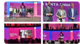
Escola Pia Mataró y 5 más 21:16 · 29 jun. 22 · Twitter for iPhone

Molt contents de rebre un reconeixement #premis #fpcat a la trajectòria de l'FP de l'@escolapiamataro #somfp #fpescolapia Traducció: Tweet