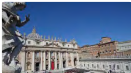
Les víctimes del franquisme reclamen al Vaticà que obri els arxius de la dictadura DC, 29/06/2022