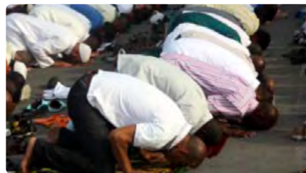
La Paeria dona via lliure a la mesquita més gran de Lleida DC, 29/06/2022 | NACIÓ DIGITAL