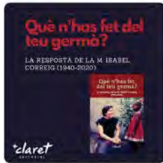
20:02 · 29 jun. 22 · Hootsuite Inc.