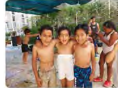
9:01 · 29 jun. 22 · Hootsuite Inc.

Fundació Comtal @FundacioComtal Comencem les activitats d'estiu amb moltes ganes e il·lusió, però et necessitem per garantir que visquin l'estiu que es mereixen. Fes possible el seu estiu! Col·labora. Ajuda'ls! #LleureEducatiu #FemPossibleElSeuEstiu #EstiuSolidari Traducció: Tweet