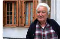
10:09 · 30 jun. 22 · Twitter Web App

Sant Joan de Déu CAT @OSantJoandeDeu La gent gran en situació de sense llar és un dels col·lectius més vulnerables de la nostra societat. Per això @SJD_SS_Bcn, en aliança amb la @FBoschAyermerich, desenvoluparà un projecte innovador per a facilitar-los l'accés a un habitatge digne. sjd.es/serveis-social... Traducció: Tweet