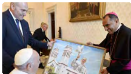
El Papa acaba amb els rumors sobre la seva suposada renúncia DC, 22/06/2022 | LA VANGUARDIA