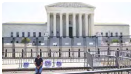
El Suprem dels EUA avala l'ús de diners públics per a l'educació religiosa DC, 22/06/2022 | EL PERIÓDICO