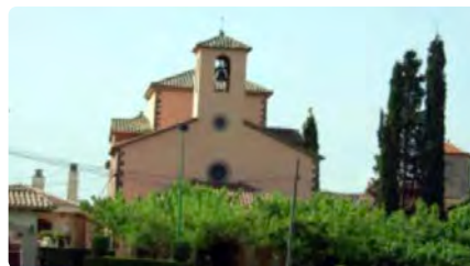
Santpedor programa una visita a Santa Anna i Santa Maria de Claret DC, 22/06/2022 | NACIÓ DIGITAL