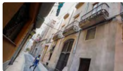
Compra de l'immoble amb vestigis de l'antiga sinagoga de Valls DJ, 23/06/2022 | DIARI DE TARRAGONA