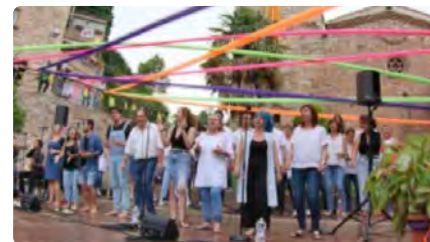
El retorn del Campus Gospel de Rajadell uneix cors europeus i figures americanes DC, 22/06/2022 | REGIÓ 7