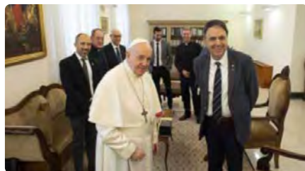
El govern reconeix que "és complicat" que el Papa acabi visitant Manresa DM, 21/06/2022 | REGIÓ 7