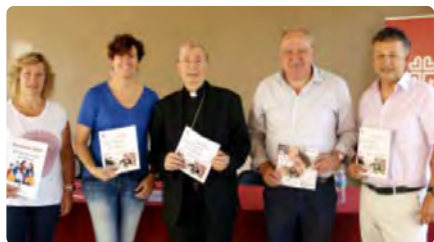
Càritas Lleida, Solsona i Urgell destinen 6,5 milions d'euros el 2021 per atendre les persones DM, 21/06/2022 | NACIÓ DIGITAL