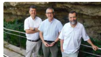
La Cova de Manresa no tindrà un superior, sinó tres responsables DJ, 23/06/2022 | REGIÓ 7