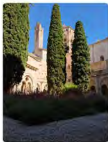
10:16 · 14 Jun. 22 · Twitter for iPhone

Monestir de Poblet @MonestirPoblet A partir de demà, 15 de Juny, les Vespres passen a les 19:00h. I l'horari de visita al Monestir passa a ser: M atins de 10:00 a 12:30 i Tardes de 15:00 a 18:30. C aps de setmana i festius, Matins de 10:30 a 12:30 i Tardes de 15:00 a 18:30. Traducir Tweet