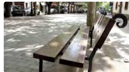
Un banc del Passeig de Solsona recordarà la petjada de mossèn Jesús Huguet DV, 17/06/2022 | NACIÓ DIGITAL