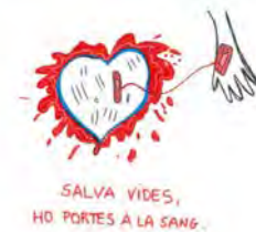
14:30 · 14 Jun. 22 · Matricol

Escoles FEDAC @EscolesFEDAC Sabeu que cada dia calen 1.100 donants de sang? Avui és el #DiaMundialDelDonantDeSang i un bon dia per fer-ho. Els nostres alumnes estan molt sensibilitzats perquè lideren campanyes per fomentar les donacions en el seu entorn en projectes #ApS. Feu-ho! donarsang.gencat.cat Traducir Tweet