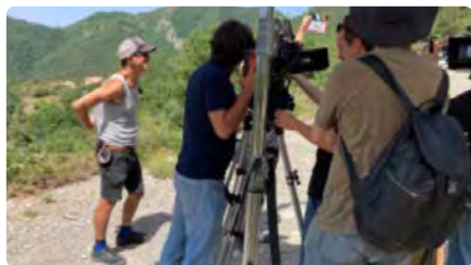
Roden al Ripollès una pel·lícula sobre els últims dies de Xirinacs DJ, 16/06/2022 | EL PUNT AVUI