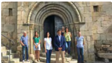
La Cerdanya obre una nova ruta del romànic centrada en les portalades DC, 15/06/2022 | REGIÓ 7