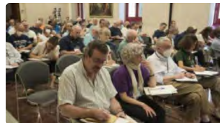
Un centenar de jesuïtes tracten a Manresa com acostar els "Exercicis" al món actual DJ, 16/06/2022 | REGIÓ 7