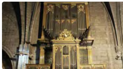
Més de 100 cantaires oferiran un concert a la Catedral de Solsona en benefici de la restauració de l'orgue DV, 17/06/2022 | NACIÓ DIGITAL