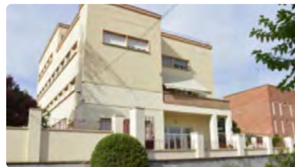
Les germanes del Cor de Maria deixen de tenir cura dels infants a la Llar Mare Esperança a Lleida DV, 17/06/2022 | LA MAÑANA