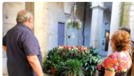
L'ou com balla torna a la Seu de Manresa DJ, 16/06/2022 | REGIÓ 7