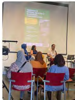
19:03 · 15 Jun. 22 · Twitter for iPhone

Obs Blanquerna @ObsBlanquerna Informe anual de la #islamofòbia a #Catalunya 2021