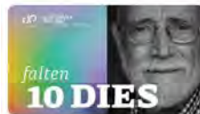
Méns Unides ONG y 6 más · 16:34 · 17 Jun. 22 · Twitter Web App

Justícia i Pau @JusticiaIPau #SetxPau i T an sols falten 10 DIES perquè comenci la Setmana per la Pau - Arcadi Oliveres! No et perdís aquest esdeveniment! Entra al web i informa't dels horaris dels diferents actes justiciapau.org/setmanaperlapau... Traducir Tweet