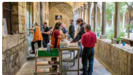
Barcelona retalla l'ajuda a Santa Anna i l'església la rebutja DC, 15/06/2022 | LA VANGUARDIA