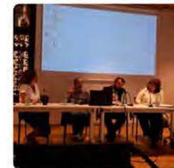
10:01 · 17 Jun. 22 · Twitter Web App

Fundació Pere Tarrés @Fundperetarres Avui representants de la @Fundperetarres assistim al seminari "Estat de la immigració a Catalunya", promogut per la @FundacioAcsar i que analitza l'accés de la població migrada i racialitzada a sectors com la salut, l'educació, l'habitatge o l'ocupació. Traducir Tweet