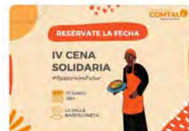
9:00 · 17 Jun. 22 · Hootsuite Inc.

Fundació Comtal @FundacioComtal Avui és el gran dia! Us hi esperem a les 20h per celebrar el IV Sopar Solidari #RescrivimFutur, gaudir de màgia en directe, d'un menú degustació boníssim, i de la millor companyia possible, vosaltres! Traducir Tweet