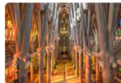
14:34 · 17 Jun. 22 · Twitter Web App

La Sagrada Família @sagradafamilia Demà, la Sagrada Família celebra la Vetlla Eucarística Diocesana del Corpus. Es podrà seguir en directe a partir de les 21 h aquí: livestream.com/accounts/32460... Traducir Tweet