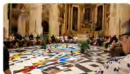
17:00 · 16 Jun. 22 · Hootsuite Inc.

Jesuites Catalunya @jesuitescat Com es poden fer els Exercicis Espirituals als marges socials, amb els més pobres i desplaçats de la societat? I quins canvis provoca aquesta perspectiva? Se'n va parlar aquest dimarts a les @CovaSantignasi ow.ly/Ven750JySqb Traducir Tweet