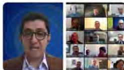
11:08 · 14 Jun. 22 · Twitter Web App

Maristes Catalunya @MaristesCat En marxa el webinar #ChampagnaGlobal per als directors i directores de les escoles #maristes de tot el món! Connectats per primera vegada a la història!!! Teixint la Xarxa Global Marista d'Escoles. Quina joia, aquesta manera de compartir!! Traducir Tweet