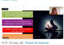
11:17 · 21 may. 22 · Twitter for Android

Escola Pia Nostra Senyora @epnospiaucacio La #MontserratDolç ens diu que tenim l'ull poc entrenat i que és tot un repte posar esforços en #salutmental amb investigacions i xerrades com aquesta. #jornadaescolapia