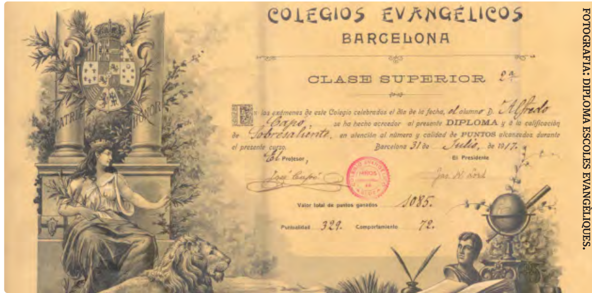
FOTOGRAFIA: DIPLOMA ESCOLES EVANGÈLIQUES.

Jandro Amenábar 'Mientras dure la guerra'. En el bàndol republicà, la situació és diferent. Al principi de la guerra tots els temples tanquen, però després, reobren les seves activitats. Ara bé, els inicis de la Guerra Civil van ser molt difícils per les escoles metodistes del Clot i Poblenou. Són unes setmanes molt marcades per la crema de temples i convents catòlics, però a Barcelona, a la matinada del 19 de juliol,