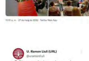
10:51 a. m. · 27 de maig de 2022 · Twitter Web App

Vedruna Catalunya Educativa @VedrunaCat Només podem dir-vos #gràcies pel vostre ser i fer Vedruna. Avui a Vic, iniciem HORIZONS, primera trobada amb els docents que comencen la jubiliació. Sempre sereu referents de les nostres escoles!