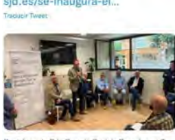
Sant Joan de Déu Serveis Socials Barcelona y 7 más 17:51 · 25 may. 22 · Twitter Web App

Sant Joan de Déu CAT @OHSantJoandeDeu Avui s'han inaugurat les noves instal·lacions del centre diürn Folre, a Badalona, dedicada a l'atenció de persones en situació de sense llar. Folre està preparat per atendre diàriament fins a 35 persones.