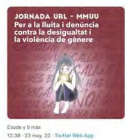
Esade y 9 más 12:38 · 23 may. 22 · Twitter Web App

U. Ramon Llull (URL) @uramonllull S'acosta la Jornada anual #URL & @MansUnides! La celebrem el 10/06 al campus @LaSalleBCN i la dediquem a la lluita i la denúncia contra la #desigualtat i la violència #gènere Consulta el programa: bit.ly/3lzzH3T A quin taller t'apuntes? bit.ly/3lzeslJ