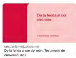
8:00 · 27 may. 22 · Hootsuite Inc.

Jesuïtes Catalunya @jesuistescat EIDES publica "De la ferida al cor del món", que recull conferències i testimonis escoltats en el curs del mateix títol que es fa realitzar la tardor de 2021 a Barcelona. Trobareu el quadern aquí: