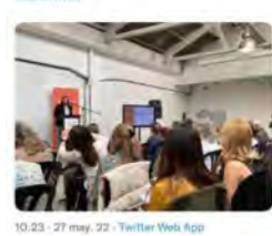
10:23 · 27 may. 22 · Twitter Web App

Maristes Catalunya @MaristesCat Som a la trobada general de l' #AcordCiutada per una #BcnInclusiva . S'hi presenta la tasca d'aquest últim any i s'estableixen les línies de treball per al curs vinent. Atents a la taula rodona sobre perspectives comunitàries en la intervenció social. #ASGabella #FundacióEscó