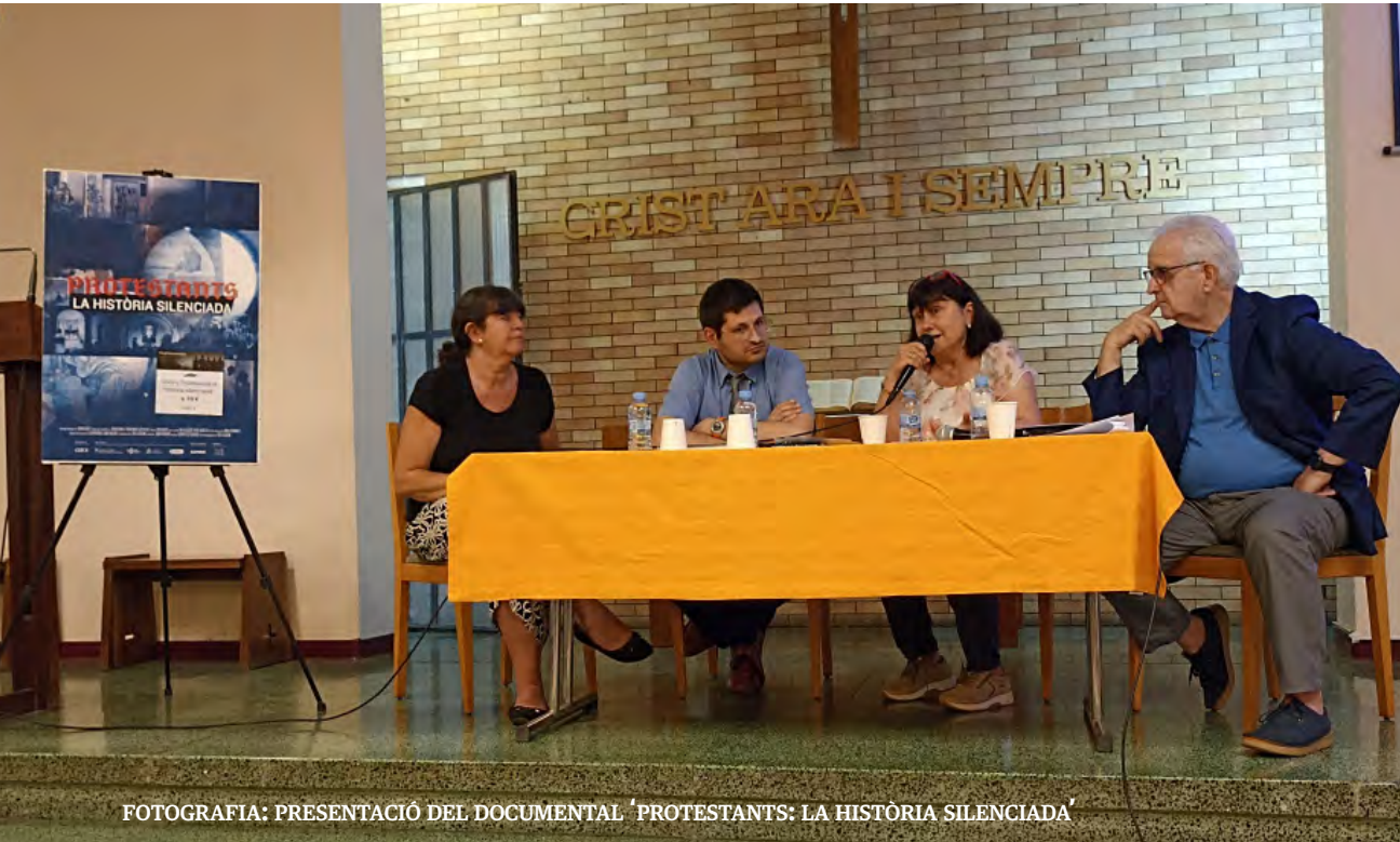
FOTOGRAFIA: PRESENTACIÓ DEL DOCUMENTAL 'PROTESTANTS: LA HISTÒRIA SILENCIADA'