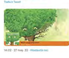
14:02 · 27 may. 22 · Hootsuite Inc.

Libreria Claret @LibreriaClaret En Resi és un arbre petit que viu al mig del bosc amb els seus amics. No et perdís el booktràiler del conte infantil que vol ajudar a prevenir i detectar els abusos sexuals i els maltractaments infantils.