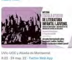
UVic-UCC y Abadía de Montserrat 8:22 · 24 may. 22 · Twitter Web App

Publicacions de l'Abadia de M... @PubliAMontserrat Ja s'acosta la 12a edició de l'Escola d'Estiu de Literatura Infantil i Juvenil a Montserrat! Els dies 6 i 7 de juliol se celebraran les Jornades Internacionals sobre imaginació i realitat. Famílies i infants a la LJJ.