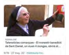
9:19 · 27 may. 22 · Hootsuite Inc.

La Salle @LaSalleCat No us perdeu aquest reportatge de TV3 on surten 3 alumnes de La Salle Girona parlant del seu projecte de voluntariat d'aprenentatge i Servei ow.ly/9bRV30skFnM @GironaSalle #SomLaSalle #MiraMésEnllà #EstàsACasa