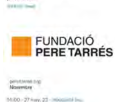
14:00 · 27 may. 22 · Hootsuite Inc.

Fundació Pere Tarrés @FundacioPereTarrés Demà és el #DiaInternacionalJoc , un dret de tots els infants, adolescents i joves, segons la Convenció dels Drets dels Infants. Però per què és important aquest dret? Aquí t'ho expliquem alhora que t'ofereim recursos posar-lo en pràctica.