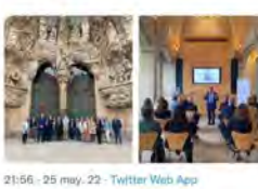
21:56 · 25 may. 22 · Twitter Web App

La Sagrada Família @sagradafamilia Avui ens han acompanyat membres de la direcció de @RTVEcatalunya Hem tingut l'oportunitat d'explicar-los el projecte de construcció i, posteriorment, han realitzat una visita a la Basílica. Gràcies per visitar-nos.