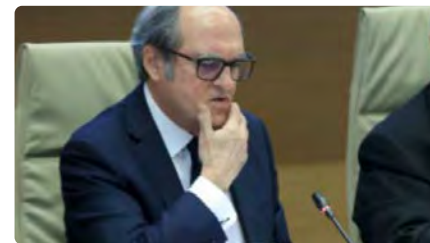
El Defensor del Poble obrirà una bústia electrònica i una oficina per atendre les víctimes d'abusos a l'Església DV, 20/05/2022 | EL PAÍS