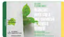
Justícia I Pau 12:59 · 20 may. 22 · Twitter Web App

Cristianisme i Justícia @CJusticia Acte en motiu de la Setmana Laudato Si', dilluns vinent a la sala d'actes de @CJusticia . Us hi esperem! Més informació: cristianismejusticia.net/ 7-anys-de-lenc... Traducció Tweet