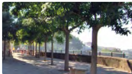
El Suprem dona la raó a Caldes de Montbui en el litigi amb el bisbat per la plaça Pau Surell DC, 18/05/2022 | EL 9 NOU