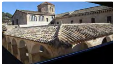
El monestir de Sant Daniel de Girona acull un trobada d'escriptors DV, 20/05/2022 | EL PUNT AVUI