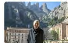
12:36 · 18 may. 22 · Hootsuite Inc.

Abadia de Montserrat @montserratinfo Acte públic en record del P. Josep Massot i Muntaner - Les Publicacions de l'Abadia de Montserrat ( https://www.montserrat.cat/ ) #Notícies abadiamontserrat.cat/ acte-public-re... Traducció Tweet