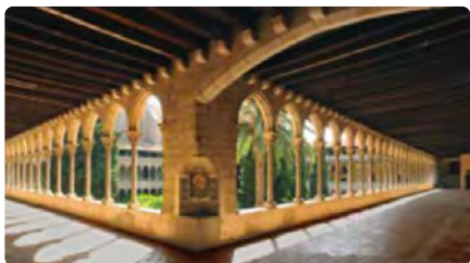
Natura, humanitat i diàleg, al Monestir de Pedralbes DM, 17/05/2022 | NÚVOL