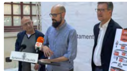
Igalada se suma a la celebració de l'any ignasià amb una agenda pròpia d'actes DJ, 19/05/2022 | REGIÓ 7