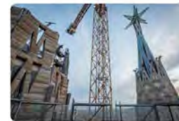
10:38 · 19 may. 22 · Twitter Web App

La Sagrada Família @sagradafamilia La torre de Jesucrist assolirà els 125,87 metres d'alçada al juny 📌 + informació: sagradafamilia.org Traducció Tweet