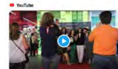
Mostra Audiovisual Josep Maixenchs 2022 La Mostra Audiovisual Josep Maixenchs celebra l'11a edició, amb el lema "Enfoca el camí". La Mostra és una cita consolidada que reuneix als alumnes de b... Obre en l'aplicación YouTube 19:59 · 17 may. 22 · Twitter Web App

Escola Pia Catalunya @escolapiacat Aquest dilluns s'ha celebrat l'11a edició de la Mostra Audiovisual Josep Maixenchs a la @filmotecacat . Gràcies a tots per a participar-hi i moltes felicitats als guanyadors!! #escolapiacatalunya #mostrajosepmaixenchs #filmotecadecatalunya Traducció Tweet