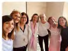
22:05 · 19 may. 22 · Twitter for Android

Vedruna Catalunya Educació @VedrunaCat A Vedruna eduquem per a ser! Aquest dijous a Vic, primera trobada de les escoles que ja imparteixen el programa Escola Atenta. Una magnífica eina per treballar la #interioritat a l'aula ✨ #escolacompromesa #silenci #consciència Traducció Tweet