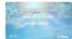
137 reproduccions 8:01 · 19 may. 22 · Mehtool

Escoles FEDAC @EscolesFEDAC Bona diada de #SantFrancescColl ! Avui és un dels dies assenyalats en el nostre calendari. A les #escolesFEDAC recordem el nostre fundador i la seva llum perquè ens ajudi a crear comunitat i a trobar el sentit en el que fem i ens proposem! @anunciataCAT #avuidemà #TUtopia Traducció Tweet