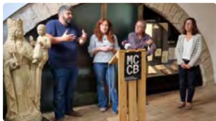
El Museu Comarcal de la Conca de Barberà adquireix la talla d'una Mare de Déu del segle XV DJ, 19/05/2022 | INFOCAMP DE TARRAGONA