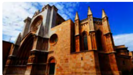
Portes obertes al conjunt de la Catedral de Tarragona amb motiu del Dia dels Museus DC, 18/05/2022