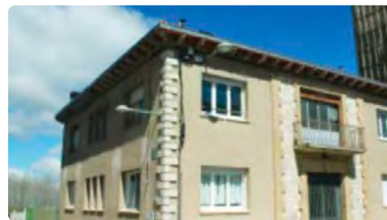
El bisbat de Solsona destinarà immobles com a habitatges d'acollida per a refugiats DV, 20/05/2022 | NACIÓ DIGITAL