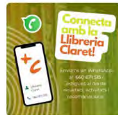
10:01 · 20 may. 22 · Hootsuite Inc.

Envia'ns un WhatsApp al 660671515 i estigues al cas de novetats, activitats, recomanacions i molt més! 📱 Traducció Tweet