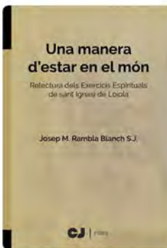
17:01 · 19 may. 22 · Hootsuite Inc.

Una manera d'estar en el món. Josep Rambla SJ ens presenta aquesta relectura dels Exercicis Espirituals de sant Ignasi de Loiola. S'acaba de publicar en català a @CJusticia ow.ly/W5jF50J10aV Traducció Tweet