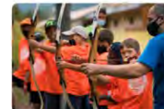
14:00 · 20 may. 22 · Hootsuite Inc.

Fundació Pere Tarrés @Fundapere 👉 T'agrada la natura? Vine als campaments d'excursionisme de la Fundació Pere Tarrés. Gaudeix d'uns dies a la natura plens d'activitats, excursions, esports d'aventura. Dormirem en tendes muntades per nosaltres mateixos! ✅ No et quedis sense la teva plaça! ow.ly/GIR550JbZku Traducció Tweet