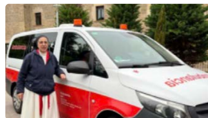
Sor Lucía ja té 18 de les 30 ambulàncies que vol portar a Ucraïna DV, 06/05/2022 | REGIÓ 7