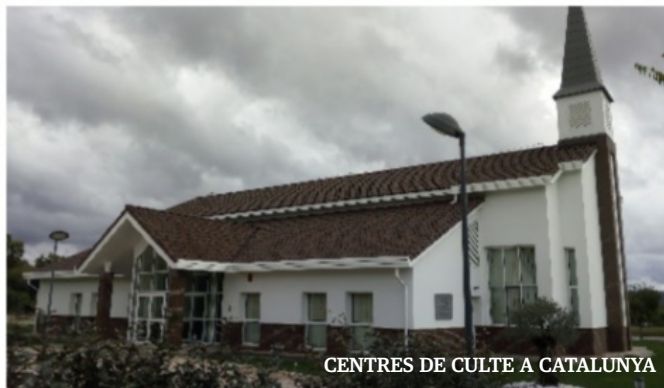
CENTRES DE CULTA A CATALUNYA