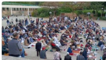
La comunitat musulmana celebra l'Id al-Fitr, la festa que posa fi al ramadà DM, 03/05/2022 | VILAWEB