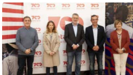
Tarragona i Constantí commemoren els 700 anys de l'arribada del Braç de Santa Tecla DJ, 05/05/2022 | CATALUNYA PRESS