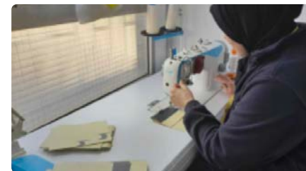
Unes 200 persones, en processos d'inserció amb Càritas Girona DC, 04/05/2022