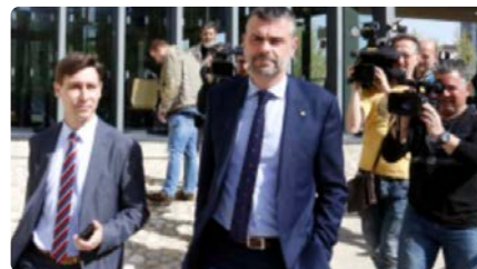
Suspès el judici a Vila i Puig pel cas Sixena perquè Bèlgica no ha notificat la citació DC, 04/05/2022 | LA MAÑANA