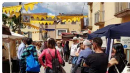
Breda a punt pel retorn de la Fira del Monestir i la Festa de l'Ajust 2022 DJ, 05/05/2022 | NACIÓ DIGITAL