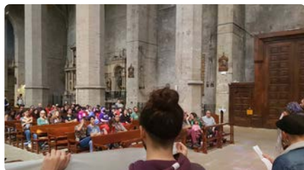
La manifestació de l'1 de Maig a Manresa acaba amb un tancament a la basílica de la Seu DL, 02/05/2022 | NACIÓ DIGITAL