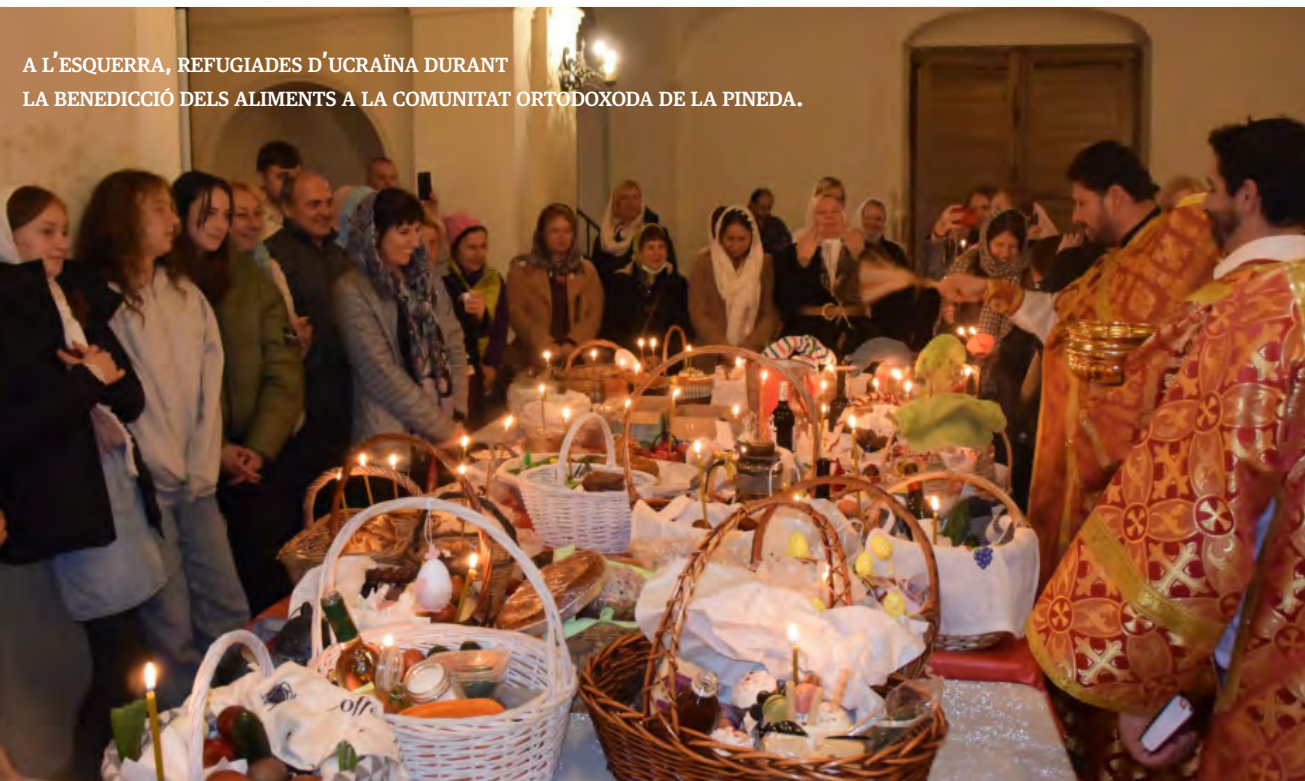
A L'ESQUERRA, REFUGIADES D'UCRAÏNA DURANT LA BENEDICCIÓ DELS ALIMENTS A LA COMUNITAT ORTODOXODA DE LA PINEDA.