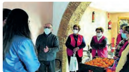
Abrera lliura lots de Nadal amb la col·laboració de Càritas Abrera DJ, 23/12/2021 | REGIÓ 7