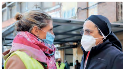
El Convent de Santa Clara reparteix 170 panettones solidaris DJ, 23/12/2021 | REGIÓ 7