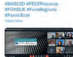
13:09 · 22 dic · 21 · Twitter Web App

IQS @IQSbarcelona En el marc de l'agrupació en tecnologies emergents BASE3D, avui 22 de desembre es dur a terme l'assemblea general en format streaming. L'IQS forma part d'aquest consorci liderat pel Centre Tecnològic CIM – UPC.