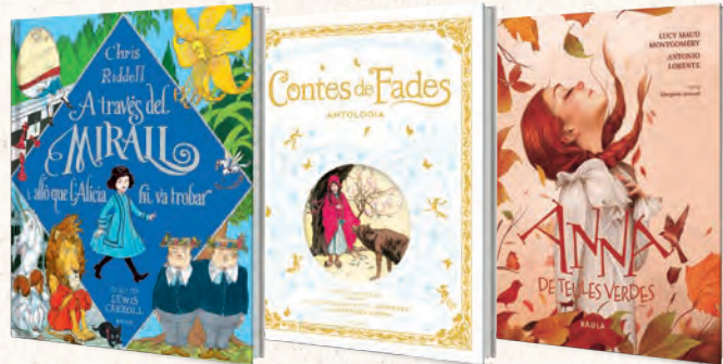
● LLIBRES REGAL