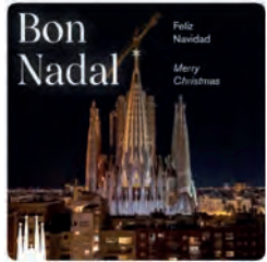
18:39 · 23 dic · 21 · Twitter Web App

La Sagrada Família @sagradafamilia En unes dates especials en què la màgia i la il·lusió són ben presents, esperem que passeu unes bones festes de Nadal!