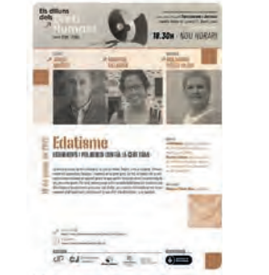
Lafederat-organitzacions per a la Justícia global y 8 mila Twitter fa resposta

En parlarem a la propera sessió de #DillunsDH el 10/01 a les 18:30 h.