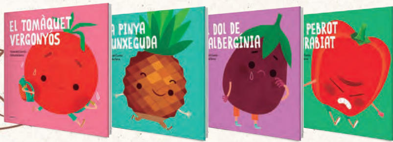
● FRUITES I VERDURES