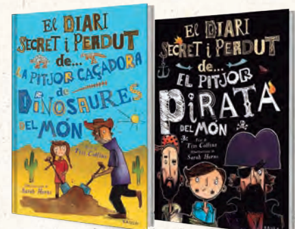
● EL DIARI SECRET I PERDUT DE...