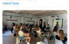
fundperetarres.org La Facultat Pere Tarrés incrementa en un 44% les beques

Fundació Pere Tarrés @Fundperetarres La Facultat d'Educació i Treball Social a Fundperetarres ha augmentat un 44% l'import destinat a beques els darrers dos cursos, en un esforç perquè la crisi econòmica per la pandèmia sigui un obstacle per als futurs professionals socials.