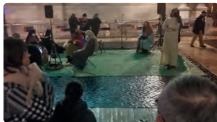
El nen Jesús torna a Sant Jaume amb un pessebre alternatiu DJ, 23/12/2021 | EL PUNT AVUI