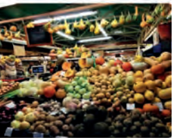
12:53 · 23 dic · 21 · Twitter Web App