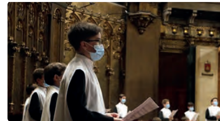
L'Escolania de Montserrat no participarà a les misses de Nadal perquè està confinada DC, 22/12/2021 | NACIÓ DIGITAL