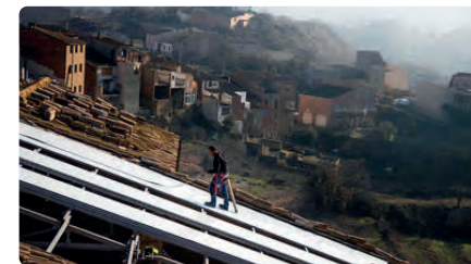
Reparen la teulada de l'església de Cervià per evitar que es desplomi DV, 23/12/2021 | SEGRE