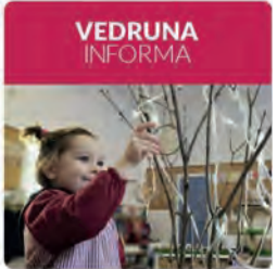
13:37 · 23 dic · 21 · Twitter Web App

Vedruna Catalunya Educació @VedrunaCat ✨ Arriba #Nadal ! Un temps especial en les nostres vides. En la roda del temps, el Nadal ens transporta cap al pensament de la família, de la llar, d'aquells que són més al nostre costat, d'aquells a qui més estemim. Llegiu-ne més al nou #VedrunaInforma ja.cat/xMxjt