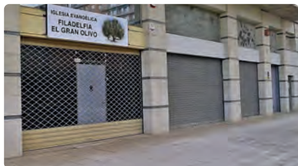
Les esglésies evangèliques són les que obren més centres de culte a la província de Girona DM, 21/12/2021 | DIARI DE GIRONA