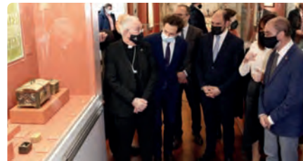
Barbastre estrena el llegat de la Franja amb 66 de les 111 obres DC, 22/12/2021 | LA MANYANA