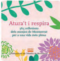
12:26 · 22 dic · 21 · Hootsuite Inc.