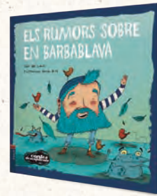
● CONTES DESEXPLICATS