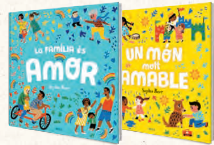
● AMB BONA CARA