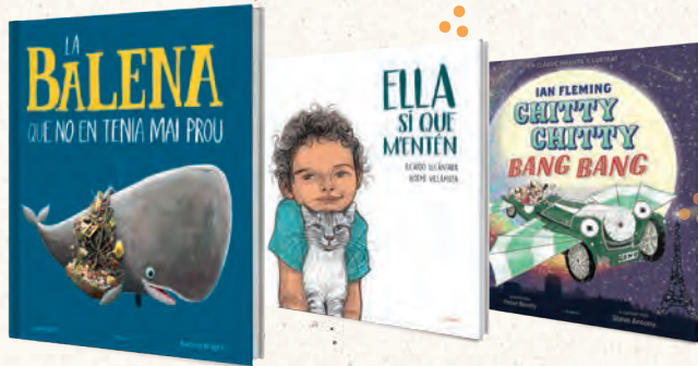
● ÀLBUMS IL·LUSTRATS