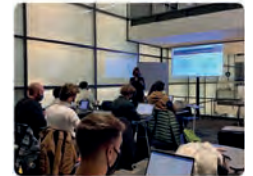
Blanquerna FCR: y 4 mila 20 25 · 21 dic · 21 desde Barcelona, España · Twitter for iPhone