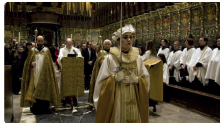
'El cant de la Sibila' ressonarà aquest Nadal per tot el país DM, 21/12/2021 | VILAWEB