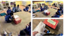
11:51 · 21 dic · 21 · Twitter for iPhone

La Salle Comtal @LaSalleComtal El veritable regal del Nadal ets tu! ✨ L'alumnat de 2n reflexiona a l'àrea d'ERE sobre què és el realment important en aquests temps! #EstàsACasa #PriComtal