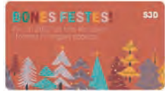
OH Aragón-San Rafael y EducaSID CAT 14:46 · 23 dic · 21 · Twitter Web App

Gràcies per ser al nostre costat! SolidaritatSJDD.org