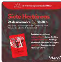
11:01 - 19 nov. 21 - Hootsuite Inc.

La Sagrada Família @sagradafamilia Ja està disponible el programa d'activitats de la inauguració de la torre de la Mare de Déu Es poden consultar tots els actes previstos i com accedir-hi a sagradafamilia.org/inauguracio