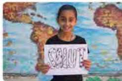
10:41 - 15 nov. 21 - Twitter Web App

Fundació Pere Tarrés @Fundperetarres SALUT | El dret a la salut implica l'absència de malalties i també el dret a disposar de condicions de benestar físic, mental i social. Dissabte celebrem el #DiaUniversalDelsDretsDelsInfants i aquesta setmana recordem els drets inclosos en la Convenció dels Drets dels Infants.