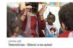
15:32 - 18 nov. 21 - Twitter Web App