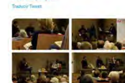
13:20 - 18 nov. 21 - Twitter Web App