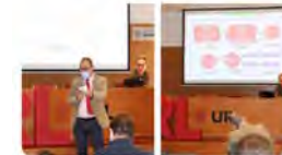
Esade y 4 más 16:53 - 19 nov. 21 - Twitter Web App

Vedruna Catalunya Educació @VedrunaCat A l'Escola Vedruna treballem el #silenci, la consciència de l'ara i aquí. #EscolaAtenta és un projecte pensat per a totes les etapes educatives Repor de @mireprats i Francesc Besses pel @TNVespre de @tv3cat #escolaambvalors #espiritualitat