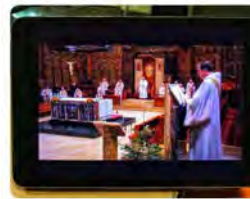
10:50 - 14 nov. 21 - Hootsuite Inc.