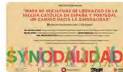
EsglésiaBarcelona ES y 2 más 15:23 - 19 nov. 21 - Twitter for iPhone

Obs Blanquerna @ObsBlanquerna Invitació: conoce iniciativas de #liderazgo en las diócesis católicas en España y Portugal. El 1 diciembre 17:30 pm, hora de Barcelona con @rafluciani, @porticusglobal y @miriamdiez @uramonlull @BlanquernaFCRI