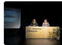
20:40 - 18 nov. 21 - Twitter for iPhone

Escotes FEDAC @EscotesFEDAC A la Presentació de l'Agenda Llatinoamericana 2022 amb la @fpcasaldaliga #avuixdemà és cura de la Terra, els Indígenes, l'Esperança i l'Alliberament humà.