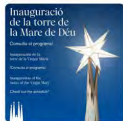
14:31 - 15 nov. 21 - Twitter Web App

La Sagrada Família @sagradafamilia Ja està disponible el programa d'activitats de la inauguració de la torre de la Mare de Déu Es poden consultar tots els actes previstos i com accedir-hi a sagradafamilia.org/inauguracio