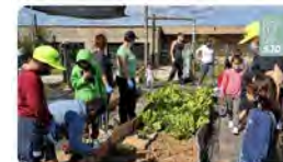
Hospital Sant Joan de Déu Palma-Inca y 5 más 17:52 - 19 nov. 21 - Twitter Web App