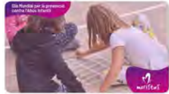
10:38 - 19 nov. 21 - Twitter Web App