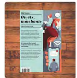
11:01 · 05 nov. 21 · Hoetsuite Inc.

Descobreix el llibre d'edicions del periscopi ow.ly/2hly50Gz5rO Traducir Tweet