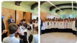
15:55 · 04 nov. 21 · Twitter for Android

#sentimlescolania #escolaniademontserrat Traducir Tweet