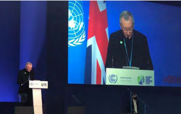
Fotografia: Intervenció del secretari d'Estat, el cardenal Pietro Parolin, a la COP26 de Glasgow en nom del Papa