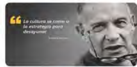
11:16 · 05 nov. 21 · Twitter Web App