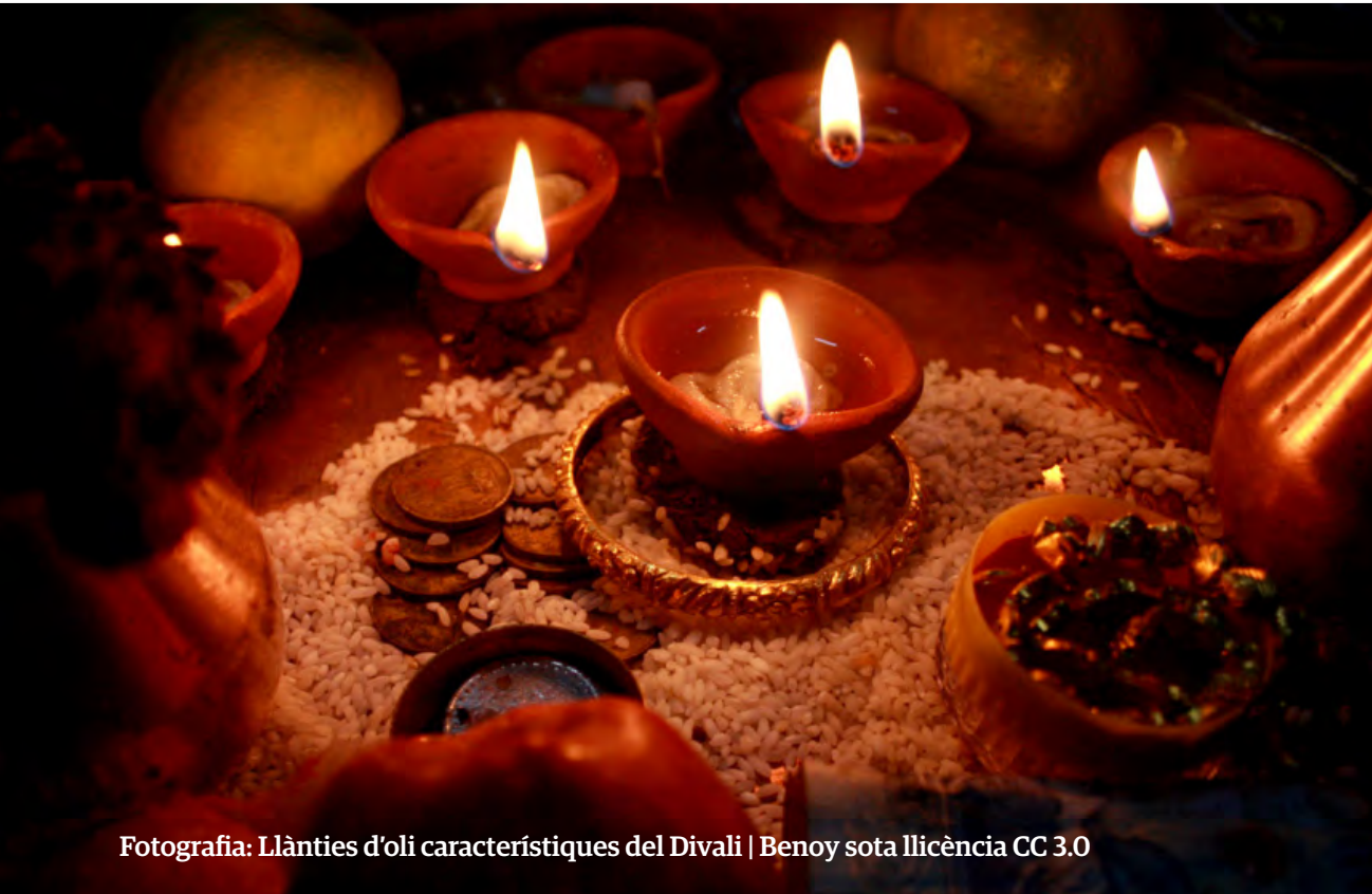
Fotografia: Llànties d'oli característiques del Divali