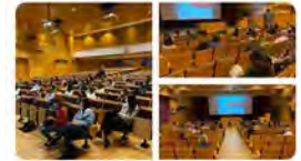
OH Aragón-San Rafael y 3 más 20:18 · 04 nov. 21 · Twitter for Android

Solidaritat Sant Joan de Déu @solidariatsjd Moltes gràcies a tots i totes les que avui heu assistit a la sessió informativa de #VoluntariatSJD! Els voluntaris i voluntàries sou peça indispensable per seguir acompanyant les persones en situació vulnerable que cuidem a Sant Joan de Déu! solidariatsjd.org Traducir Tweet