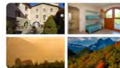
14:01 · 05 nov. 21 · Metrispool

A #Gombrèn , un bonic poble del #Ripollès , hi ha la #casaPareColl . Les #escolesFEDAC gaudim de la casa natal de Sant Francesc Coll durant #convivències , #colònies i formacions. Sabeu que hi podeu reservar una estada amb la vostra família i amics? casaparecoll.eu Traducir Tweet