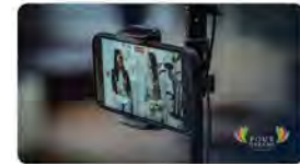
12:09 · 05 nov. 21 · Twitter Web App

Jesuïtes Catalunya @jesuitedcat Les universitats jesuïtes (IAJU) i la Companyia de Jesús promouen un concurs de cinema, una oportunitat per als seus estudiants de mostrar la seva creativitat. Aquí en teniu els detalls: fourdreamscontest.org Traducir Tweet