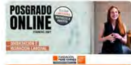
11:45 · 05 nov. 21 · Hoetsuite Inc.

Fundació Pere Tarrés @Fundperetarres Sessió informativa ONLINE Expert universitari ONLINE en orientació i inserció laboral 22.11.21 / 18h / Zoom El director del postgrau t'explicarà el pla docent, objectius, sortides professionals i metodologia Inscriu-t'hi: ow.ly/Tq4W50GASmZ Traducir Tweet