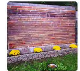
14:15 · 02 nov. 21 · Hoetsuite Inc.

Avui recordem els difunts de les nostres comunitats i famílies. Al jardí del monestir de #Montserrat tenim aquest memorial dels monjos que ens han precedit i ja són enterrats al cementiri monàstic. Avui ben dinat la comunitat farà una pregària al cementiri. Traducir Tweet