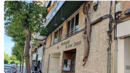
Una parròquia de Lleida no pot pagar la llum i demana ajuda per evitar tancar l'església DM, 7/09/2021 | SEGRE