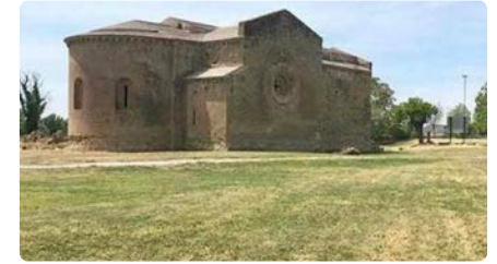
Arranca el segon Festival Llavors a Santa Maria de les Franqueses DJ, 9/07/2021