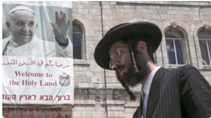
El Papa es reconcilia amb els jueus després d'una picabaralla sobre la Torà DM, 7/09/2021 | LA RAZÓN