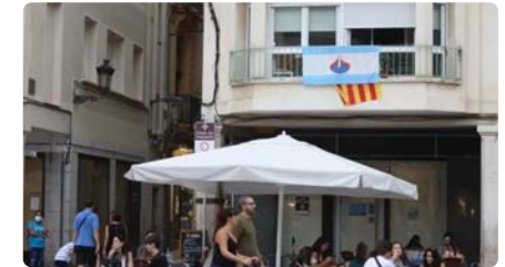
Reus és el municipi amb més confessions religioses de tota la província, una desena DM, 7/09/2021 | DIARI DE TARRAGONA