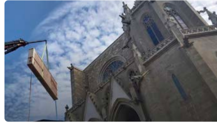
Una gran grua extreu el frontal florentí de la Seu de Manresa per a la seva restauració DV, 10/09/2021 | REGIÓ 7