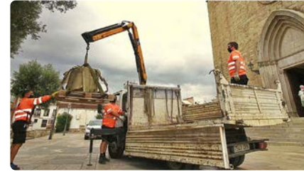
Blanes retira una clau de volta del Palau Vescomtal pels actes vandàlics DC, 8/07/2021 | DIARI DE GIRONA