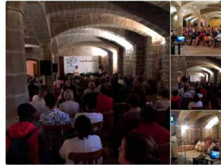
14:05 - 27 de set. de 2018

Gracias #Manresa Gràcies amics Avanzamos en la #Solidaridad y el compromiso con las personas @fundsantaclara