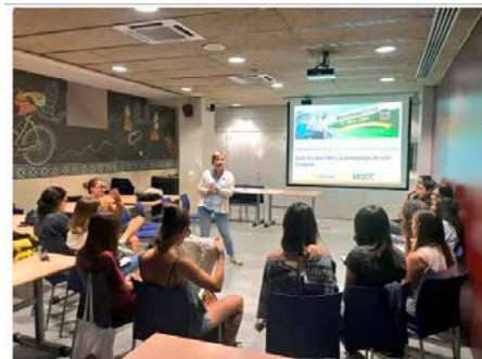
10:59 - 27 de set. de 2018

En marxa la 3a formació de #CampusMCECC! Avui treballem la pedagogia durant el curs d'esplai! Ens agrada molt veure que veniu de centres d'esplai de Berga, Salou, Sant Cugat, El Masnou, Sabadell, Barcelona... 🍕 Gràcies x assistir-hi! Som-hi amb el #NouCursMCECC! 👉 #SomMoviment