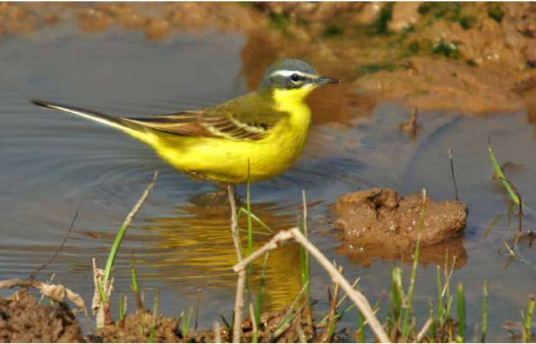
Fotografia: Cuereta groga al Delta del Llobregat.