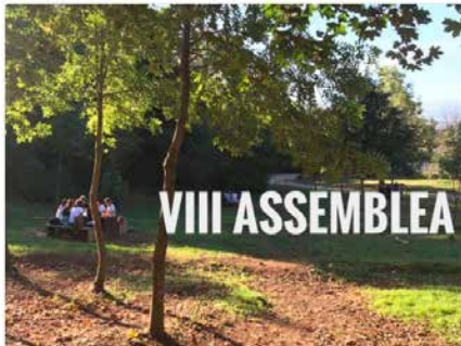
11:35 - 27 de set. de 2018

ESCOLA: cada 4 anys, totes les persones de l'@escolapiacat ens aturem per avaluar la feina feta i projectar-nos cap al futur. Avui hem preparat les propostes per la VIII ASSEMBLEA de l'Escola Pia Catalunya. @olotciutatedu @ensenyamentcat