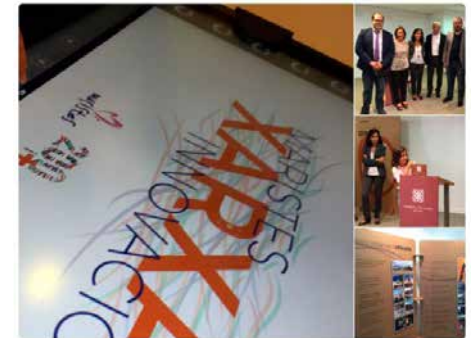
0:29 - 25 de set. de 2018

Avui fa un any que l'exposició "Maristes: 200 i +" començava a la @FundacioIuro de #Mataró un trajecte que l'ha portada a totes les poblacions catalanes on els #maristes tenim escola i/ obra social. Ara, a Barcelona (Caputxins Pompeia) fins al dia 5 d'octubre.