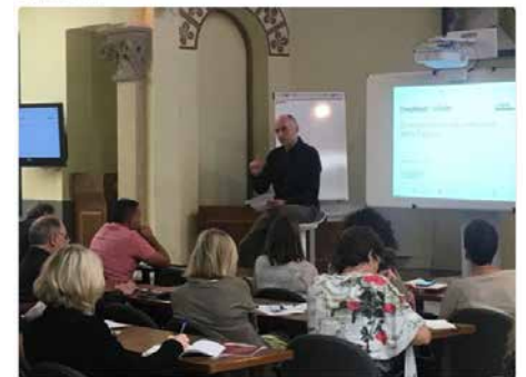
1:06 - 18 de set. de 2018 des de La Salle Universitat Ramon Llull