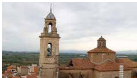
Revisaran l'estat de més de 300 esglésies de l'Arquebisbat de Tarragona i el Bisbat de Tortosa Dj, 06/09/2018 | Diari de Tarragona