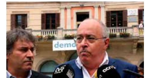
Ensenyament es mostra "convençut" que es farà una assignatura de cultura religiosa tot i topar amb l'església Dv, 07/09/2018