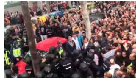
El jutge diu que la policia no podia entrar en escoles concertades l'1-0 Dj, 06/09/2018 | 324.cat