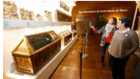
L'arquebisbe Omella visita de vacances Sixena amb el bisbe de Barbastre Dm, 04/09/2018 | Segre