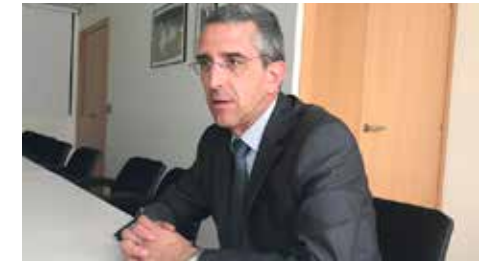
Pares de la concertada demanen que el pacte contra la segregació Dm, 04/09/2018 | Europa Press