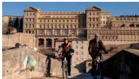
El Camí Ignasià té una ruta amb bici per evitar la carretera que ningú no promou Dj, 06/09/2018 | Regió7