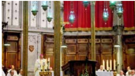
La missa d'aniversari dels 425 anys de l'Església de Solsona omple la catedral Dil, 03/09/2018 | Regió7