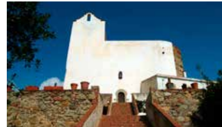
Sant Pol de Mar rehabilita l'ermita de Sant Pau Dc, 05/09/2018 | La Vanguardia