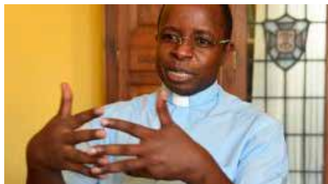
El rector de la Seu de Manresa s'hi dedicarà en exclusiva i deixa les altres parròquies Dl, 16/07/2018 | Regió7