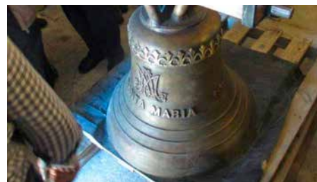
Una campana massa escandalosa per al petit poble de Senan Dj, 19/07/2018 | El País