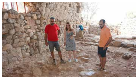
Consoliden l'església romànica de Santa Maria de Palau, a Torroella Dv, 20/07/2018 | El PuntAvui