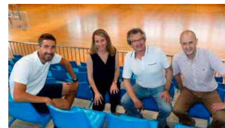
Els maristes impulsen un projecte per combinar estudis i esport d'alt nivell Dg, 15/07/2018 | Diari de Girona