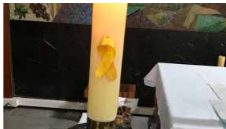
El rector de Coma-ruga retirarà el llaç, però nega haver-ho col·locat Dc, 18/07/2018 | Diari de Tarragona