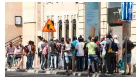
El menjador de Jericó a Lleida, desbordat Dj, 19/07/2018 | Segre