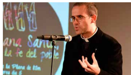
Vic nomena el rector del Poble Nou exorcista de la diòcesi Ds, 14/07/2018 | Regió 7