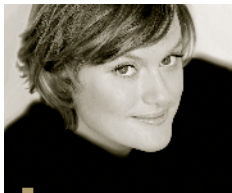
Vesselina Kasarova Mezzosoprano