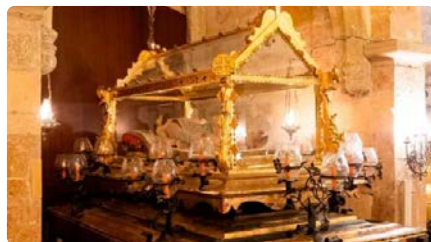
Tarragona estrena dues rutes pels espais de la Setmana Santa DT, 19/03/2024 | DIARI DE TARRAGONA