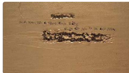
El Museu de Montserrat inaugurarà divendres l'exposició 'Laus Deo. Lamazares' d'Anton Lamazares DC, 20/03/2024 | NACIÓ DIGITAL