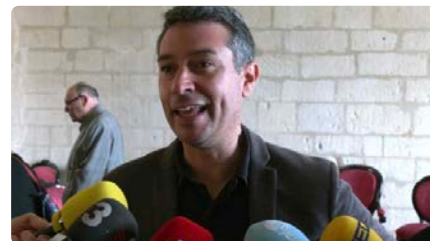
El reliquiari dels Sants Màrtirs de Gandesa torna al bisbat de Tortosa DV, 22/03/2024 | CANAL 21