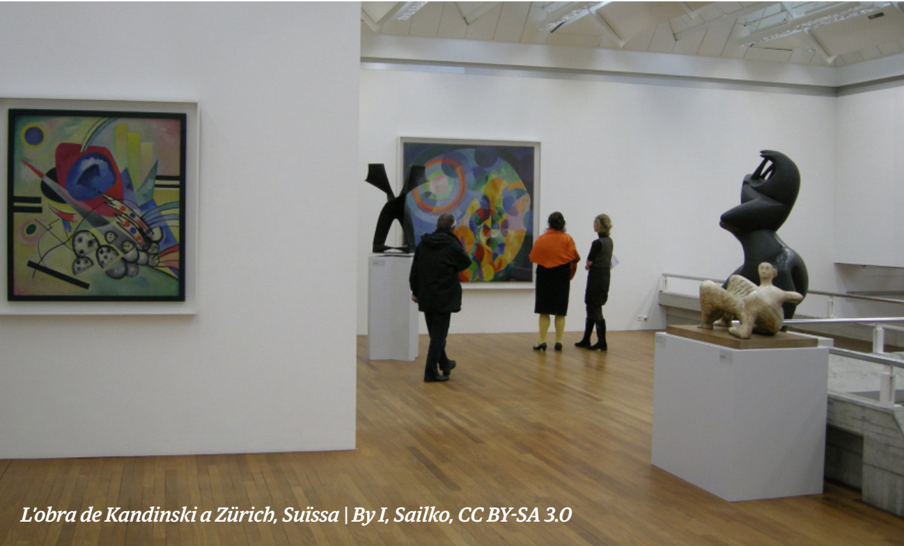
L'obra de Kandinski a Zürich, Suïssa