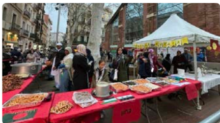
Un centenar de musulmans celebren al Clot l'iftar, l'àpat que trenca el dejuni del ramadà DL, 18/03/2024 | BETEVÉ