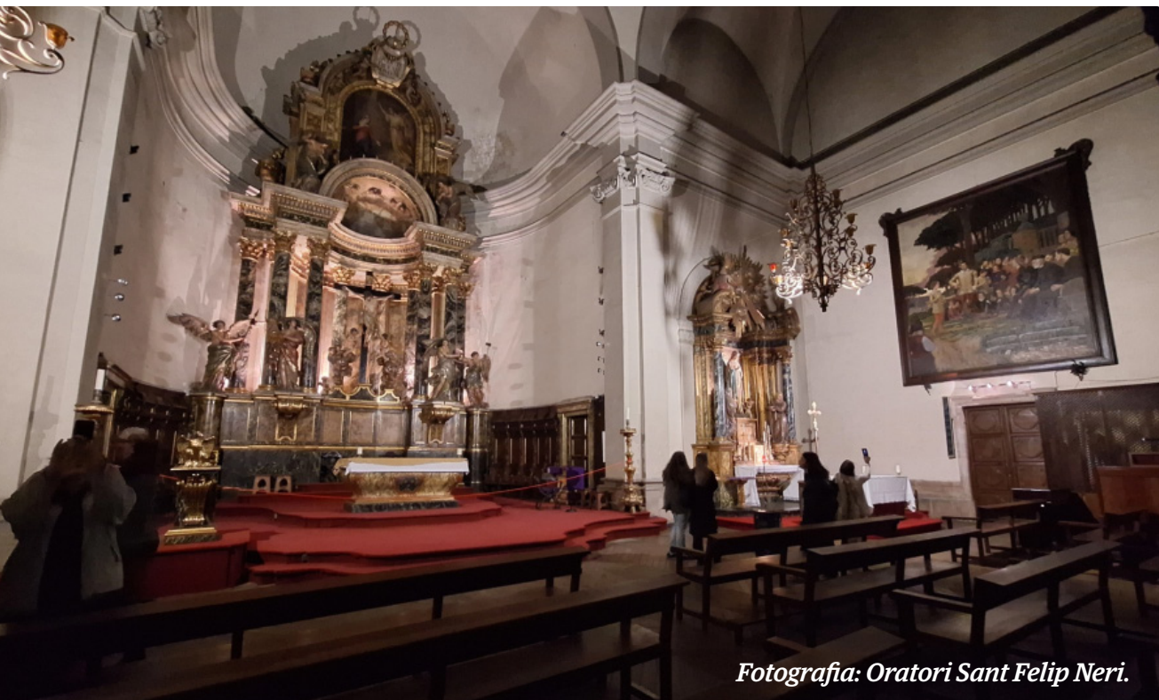
Fotografia: Oratori Sant Felip Neri.