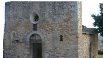
L'església de Sant Joan de Belcaire d'Empordà, declarada com a Bé Cultural d'Interès Nacional DC, 20/03/2024 | EL PUNT AVUI