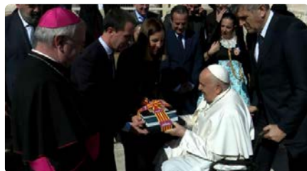
El papa Francesc rep el president del Consell de Mallorca en audiència DJ, 21/03/2024 | VILA WEB