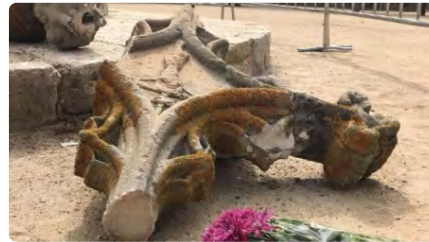
La creu de terme del monestir de Sant Cugat ja està restaurada