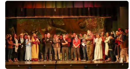
Pals recupera els Pastorets amb una proposta innovadora