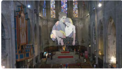
El mural 'Criança' de Santa Maria del Pi, nominat com un dels millors del món