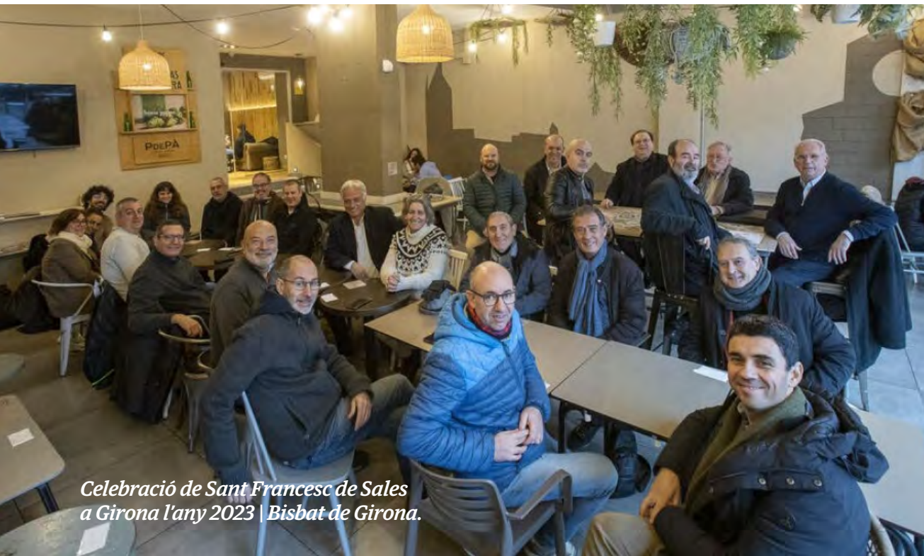
Celebració de Sant Francesc de Sales a Girona l'any 2023 |.

“L'Església té moltes històries a explicar i necessitem els mitjans de comunicació”