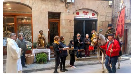
Solsona renova un any més la devoció a Sant Antoni Abat