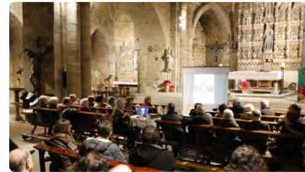
'Setmana de la Bíblia' amb art a l'església de Sant Llorenç de Lleida