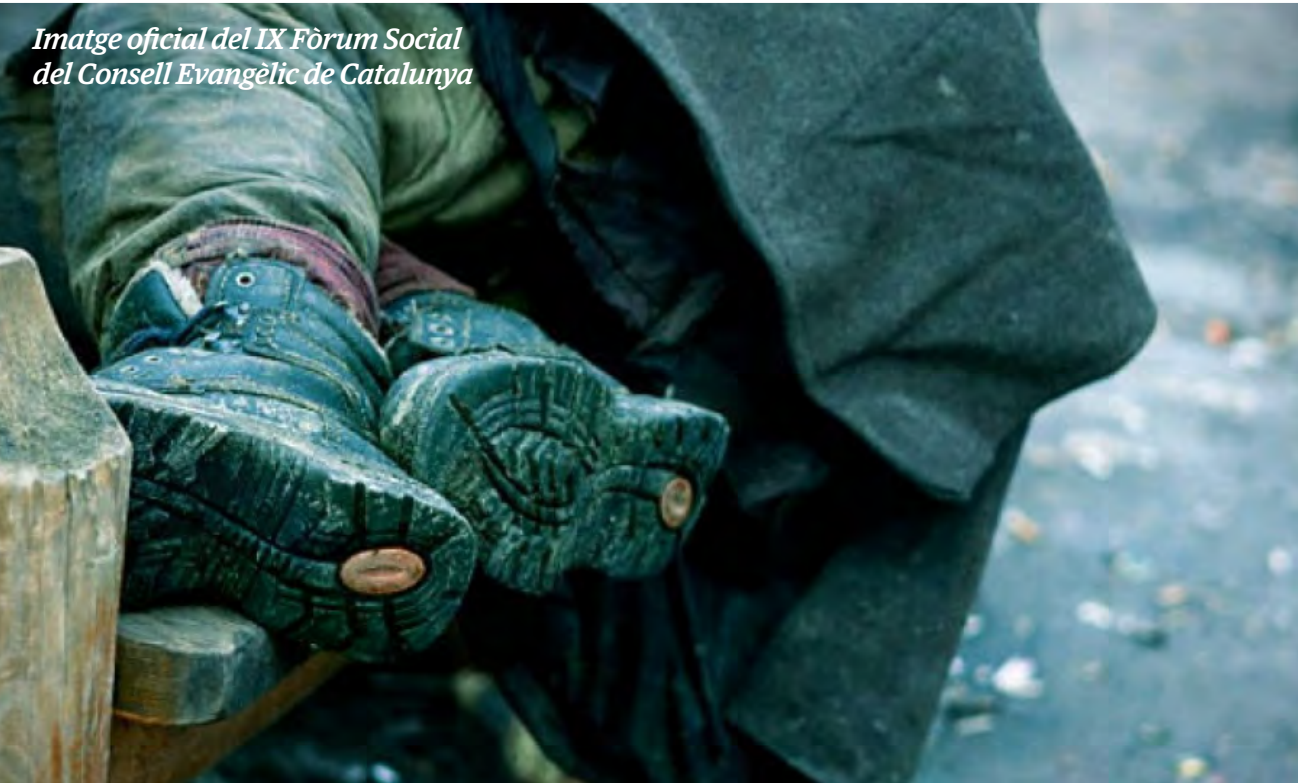
Imatge oficial del IX Fòrum Social del Consell Evangèlic de Catalunya