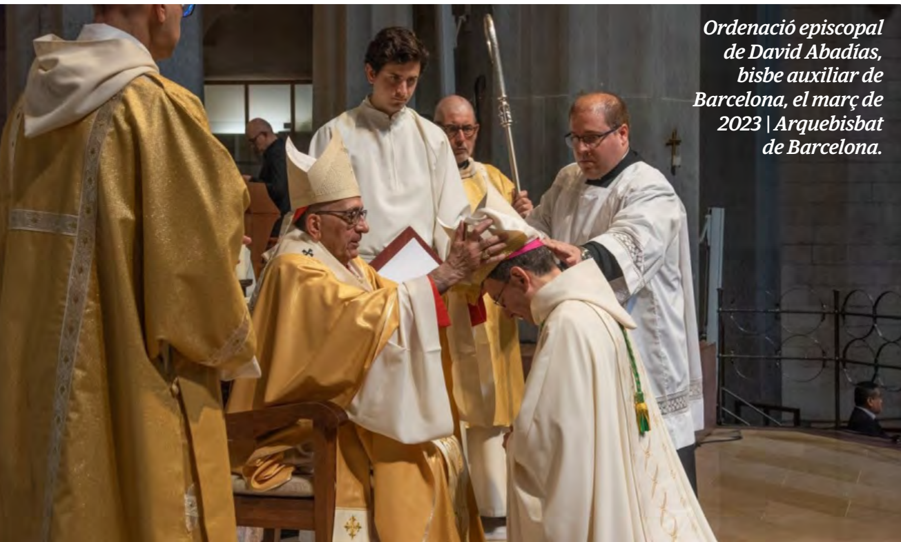
Ordenació episcopal de David Abadías, bisbe auxiliar de Barcelona, el març de 2023 | Arquebisbat de Barcelona.