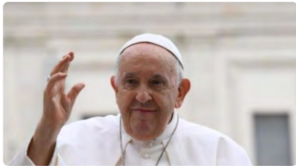
El Papa alerta del risc de la intel·ligència artificial per al periodisme sobre el terreny