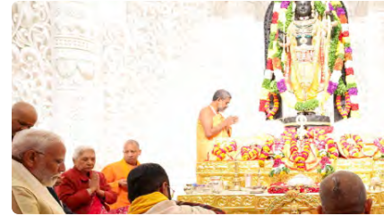
Modi inaugura un controvertit temple hindú abans de les eleccions