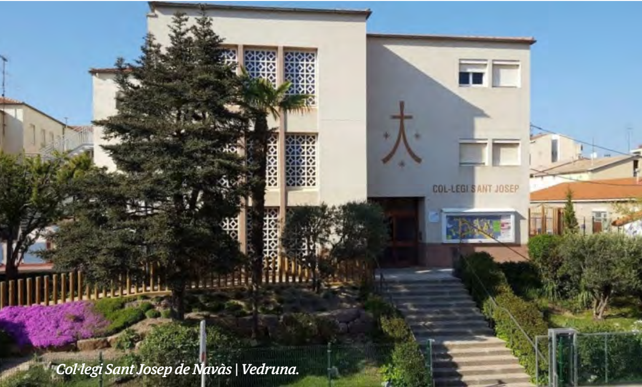
Col·legi Sant Josep de Navàs | Vedruna.