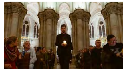
El Cant de la Sibil·la es podrà veure per primer cop al Catllar aquest Nadal DJ, 14/12/2023 | TOTS 21