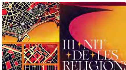
Tarragona celebra aquesta setmana la III Nit de les Religions DC, 13/12/2023 | LA CIUTAT