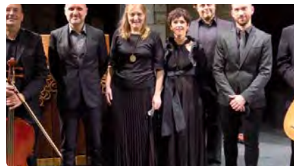
Música Antiga de Girona recorda el Nadal dels convents gironins DJ, 14/12/2023 | EL PUNT AVUI