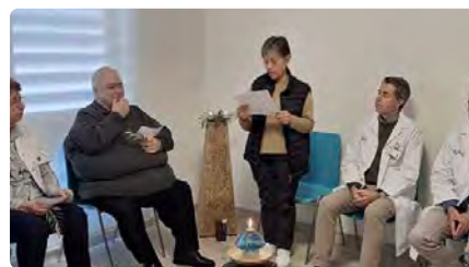
L'Hospital Sagrat Cor de Martorell estrena l'Espai de Silenci Interconfessional DV, 15/12/2023 | EL FAR