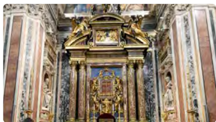
El Papa vol ser enterrat a Santa Maria Major i no pas al Vaticà DJ, 14/12/2023 | LA VANGUARDIA