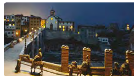
L'Agrupació Pessebrista de Roda de Ter celebra cinquanta anys DV, 15/12/2023 | NACIÓ DIGITAL