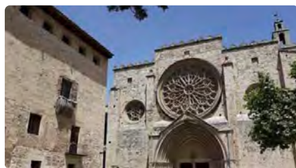
El monestir de Sant Cugat, una de les seues principals de la biennal Manifesta 15 DV, 15/12/2023 | EL PERIÓDICO