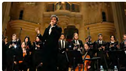
David Bisbal i Passió Vega omplen la Sagrada Família a la missa criolla 'Units per la pau' DC, 13/12/2023 | LA VANGUARDIA