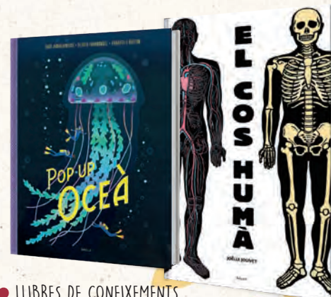
● LLIBRES DE CONEIXEMENTS