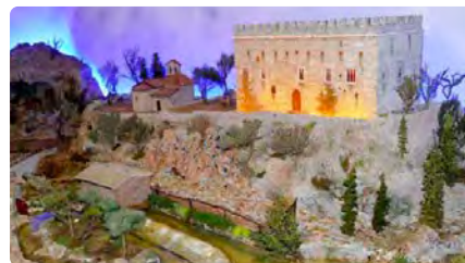
Balsareny protagonitzarà el pessebre monumental aquest Nadal al Casino de Manresa DT, 21/11/2023 | REGIÓ 7