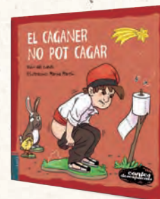
● CONTES DESEXPLICATS