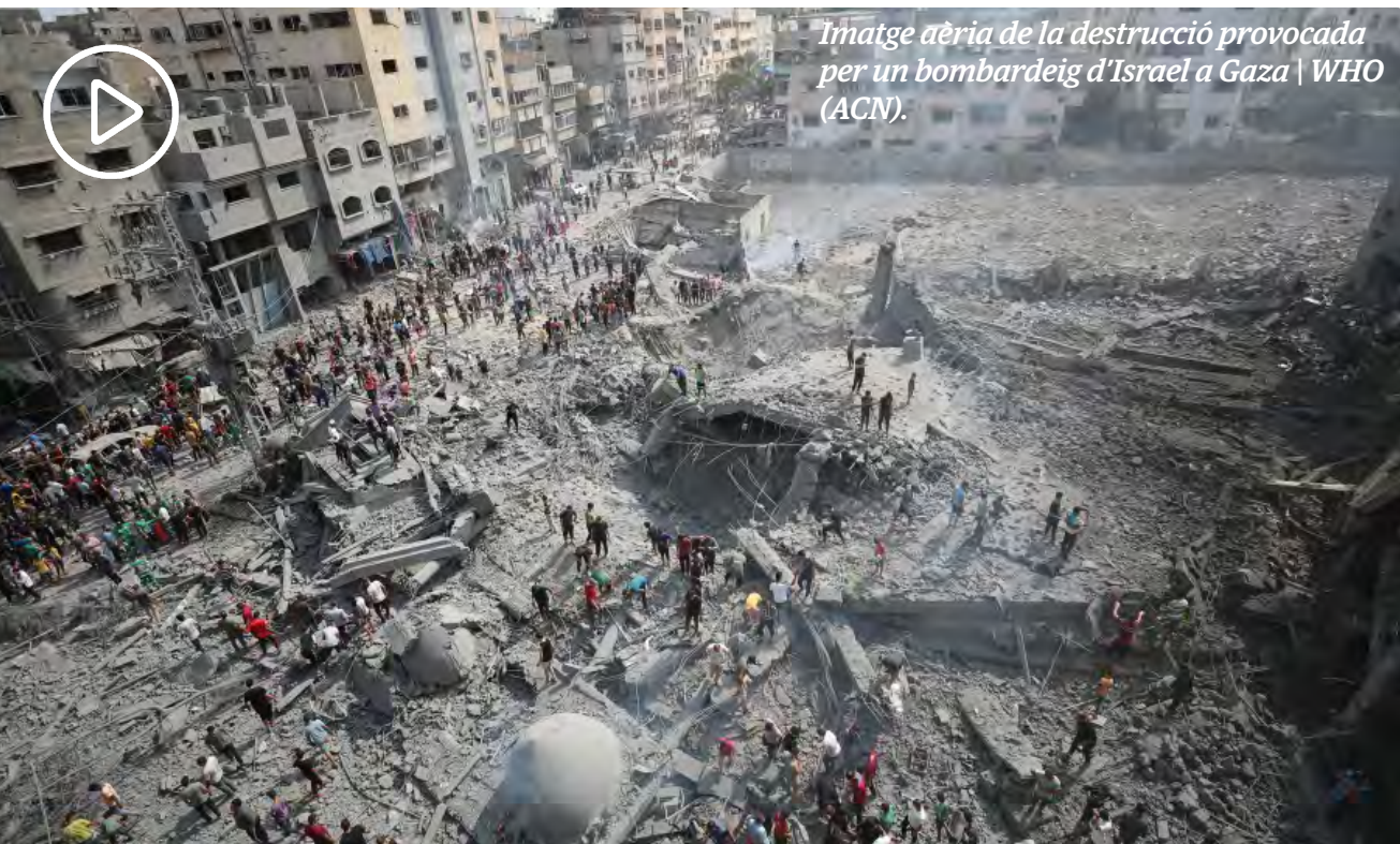
Imatge aèria de la destrucció provocada per un bombardeig d'Israel a Gaza | WHO (ACN).

“Els cristians de Palestina demanen que es conegui la seva situació a Terra Santa”