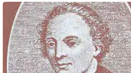
Tortosa, escenari de la cloenda de l'Any Rector de Vallfogona DV, 24/11/2023 | TORNAVEU