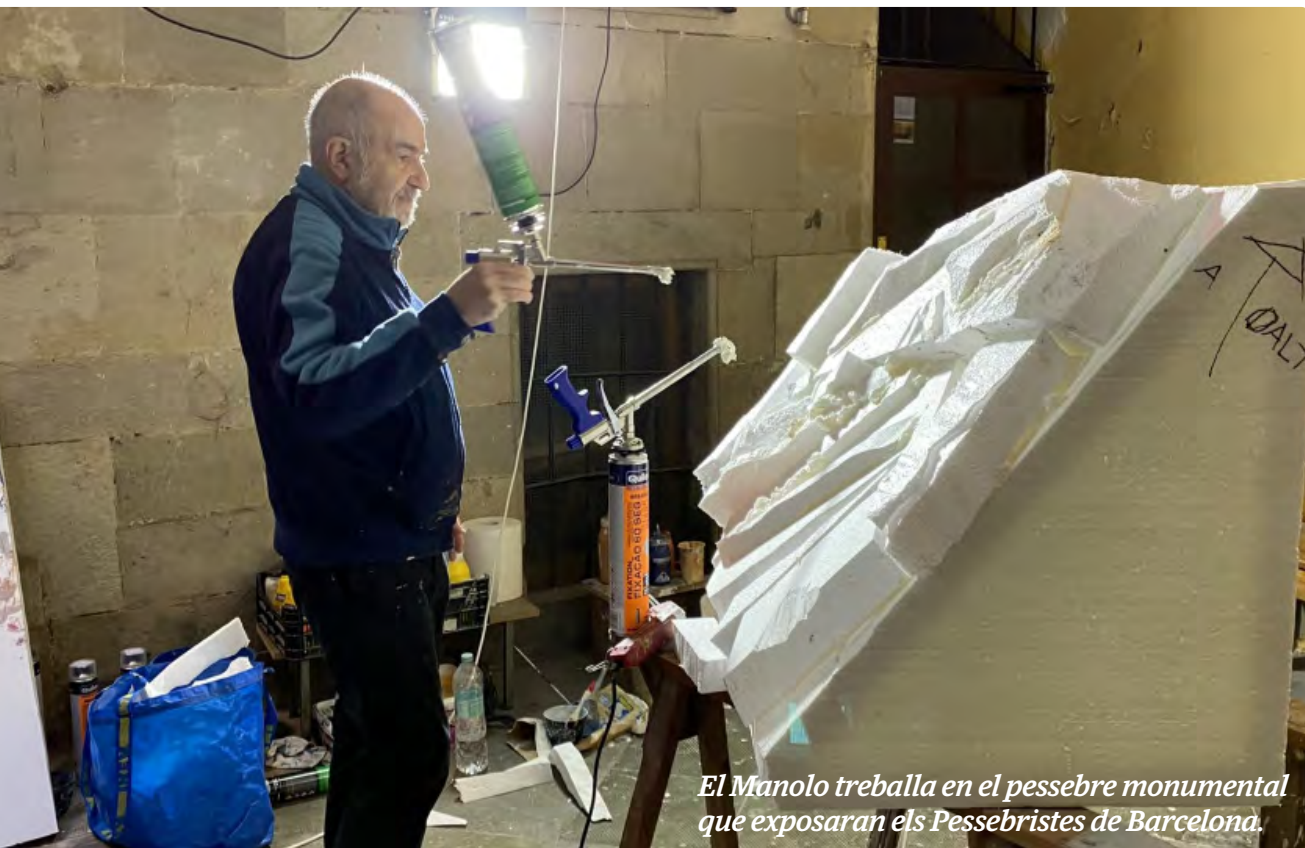
El Manolo treballa en el pessebre monumental que exposaran els Pessebristes de Barcelona.