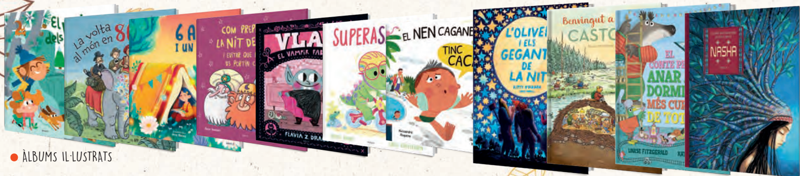
● ÀLBUMS IL·LUSTRATS