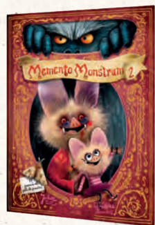
● LLIBRE REGAL