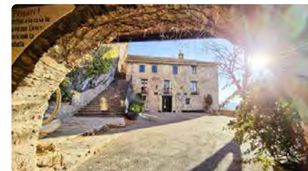
El Bisbat de Vic reobre Montgrony i dinamitza l'acollida dels seus santuaris DV, 24/11/2023 | EL 9 NOU