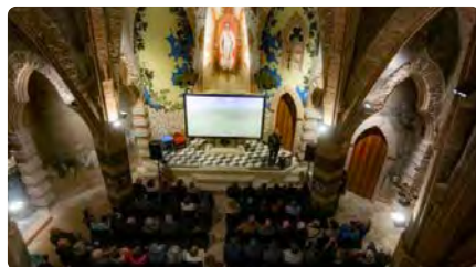
L'església de Vistabella recupera l'esplendor DL, 20/11/2023 | DIARI DE TARRAGONA