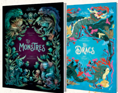
● ENCICLOPÈDIA D'ÈSSERS MÀGICS