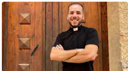
El capellà més jove de Catalunya acceptaria que les dones poguessin fer de mossens DV, 24/11/2023 | CATALUNYA RÀDIO