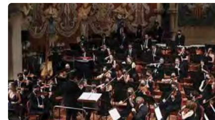
L'Església del Vendrell estrenarà mundialment la 'Missa de Glòria' de Pau Casals DC, 22/11/2023 | NACIÓ DIGITAL