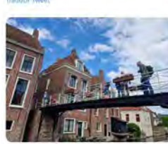
AUDIR y 9 más 18:15 · 24 may, 23 · 652 Visualitzacions

Justícia i Pau @JusticiaPau Dia internacional de les dones per a la Pau i el desarmament. Un pont estret i alt, símbol de l'esforç i el perill que suposa per a les dones d'arreu el lideratge de lluites per la dignitat, l'economia solidària, el desig d'un tracte no violent i antiracista a @FundIPau @Lafede_cat