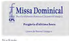
Tú y 9 más 9:00 · 24 may, 23 · 140 Visualitzacions

U. Ramon Llull (URL) @unamentlull La URL, en el Top10 d'universitats amb major rendiment d'Espanya, segons la @Fundacion_CVD