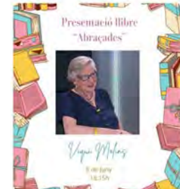
15:01 · 26 may, 23 · 35 Visualitzacions

Libreria Claret @LibreriaClaret El proper 6 de juny a les 18.15h et convidem a la presentació del llibre Abraçades, de l'Editorial Claret, al Restaurant #Fillgranes de la Llidia de Terrassa. (Rutlla, 50, 08221 Terrassa). #Thi esperem! #hospitalcampany #ViquiMolins