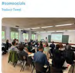
14:15 · 26 may, 23 · 82 Visualitzacions