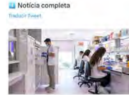
irsjd.org Noves instal·lacions de recerca destinades a l'estudi de l'oncologia infantil 15:01 · 25 may, 23 · 456 Visualitzacions

Institut de Recerca Sant Joan de D... @IRSD.info El laboratori d'oncologia infantil del @IRSD_Info @SJDbarcelona_ca celebra 20 anys de recerca estrenant noves instal·lacions, possible gràcies a les donacions de la @FundCaixa, associacions de pacients i la societat civil