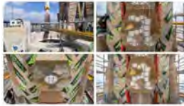
11:51 · 26 may, 23 · 2.650 Visualitzacions

La Sagrada Família @sagradafamilia CAT, Aquest mes de maig es comencen a col·locar els panells de pedra que formen part dels terminals de les torres dels Evangelistes Joan i Mateu, previs a l'icosaedre i el tetramorf. Més informació: sagradafamilia.org