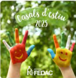
14:02 · 25 may, 23 · 258 Visualitzacions

Escoles FEDAC @EscolesFEDAC A les #escolesFEDAC tenim una proposta: els #CasalsdEstiuFEDAC! Oberts tant a alumnes de les nostres escoles com d'altres centres educatius amb una àmplia oferta d'activitats i molts moments memorables i aprenentatges! A la vostra escola FEDAC més propera us informaran!