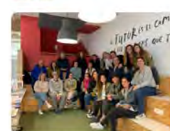
9:04 · 26 may, 23 · 144 Visualitzacions

Maristes Catalunya @MaristesCat Educadors i educadores d'escoles #maristes hem fet una visita pedagògica a l'escola #JosepMariaXandri de S. Pere de Torelló i a la @uvic_ucs. Molt enriquidor conèixer projectes pedagògics valents i compartir altres experiències d'escola. Gràcies per l'acollida! #Maristesinnova