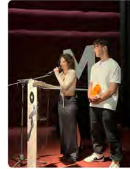
0:15 · 23 may, 23 · 1.021 Visualitzacions

Escola Pia Catalunya @escolapiacat Aquest diàlluns hem celebrat la gala de la #MostraAudiovisual Josep Maixenau. Una gala per estimular l'interès dels estudiants pels mitjans audiovisuals i incentivar la creativitat. Enhorabona als premiats i a tots i totes els/les que hi heu participat!