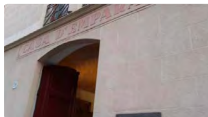
Vilanova i la Geltrú distingirà les Filles de la Caritat de Sant Vicenç de Paül DJ, 02/03/2023 | LA CIUTAT