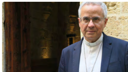
L'arquebisbe Joan Planellas es troba ingressat per una lleu pneumònia DL, 27/02/2023