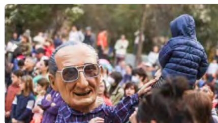
L'Aplec de Sant Medir publica el programa d'activitats d'enguany DV, 03/03/2023 | NACIÓ DIGITAL