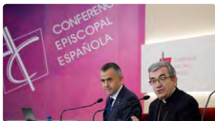
Rècord de recaptació de l'Església a través de la declaració de la renda DC, 01/03/2023 | DIARI DE GIRONA