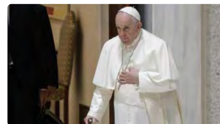
El papa Francesc: "L'Església no pot intentar amagar la tragèdia dels abusos" DV, 03/03/2023 | EL PERIÓDICO