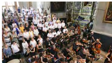
Mataró vol una participació rècord per la missa de les Santes del 175è aniversari DC, 01/03/2023 | CAPGRÒS