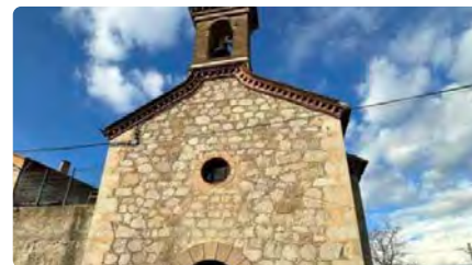
Cercs té tancada l'església de Sant Corneli fins que no es repara la teulada DC, 01/03/2023 | REGIÓ 7