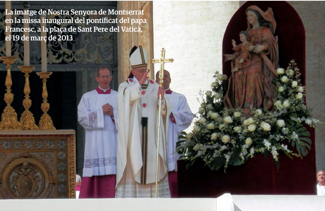
La imatge de Nostra Senyora de Montserrat en la missa inaugural del pontificat del papa Francesc, a la plaça de Sant Pere del Vaticà, el 19 de març de 2013