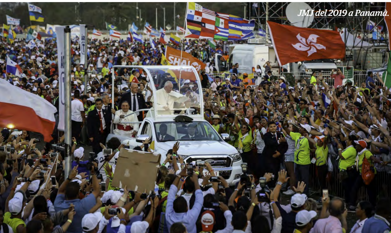
JMJ del 2019 a Panamá.