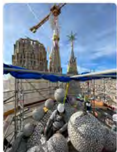
16:51 - 13 ene. 23