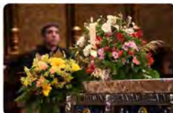
17:12 - 06 ene. 23