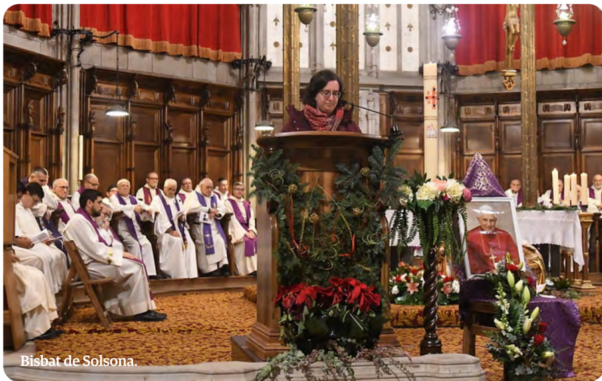
Bisbat de Solsona.