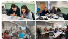
10:02 - 13 ene. 23