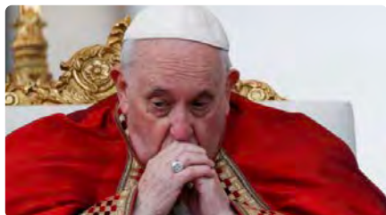
El papa Francesc diu que és "urgent" aprovar un nou acord migratori a Europa DT, 10/01/2023 | EL PERIÓDICO