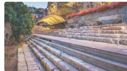
Jerusalem estudiarà la piscina on Jesús hauria guarit un cec DT, 10/01/2023 | LA VANGUARDIA