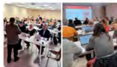
10:47 - 11 ene. 23