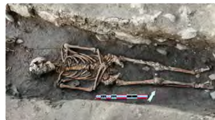
Localitzen tres tombes al monestir de Sant Pere de Cervera DV, 13/01/2023 | SEGRE