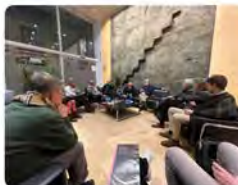
Tú y 9 más 18:34 - 10 ene. 23 desde Facultat de Comunicació