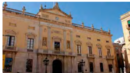
Tarragona commemora els 75 anys de presència protestant a la ciutat DT, 10/01/2023 | DIARI DE TARRAGONA