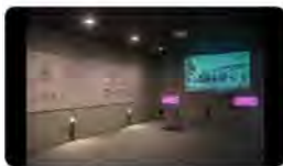
11:21 - 13 ene. 23