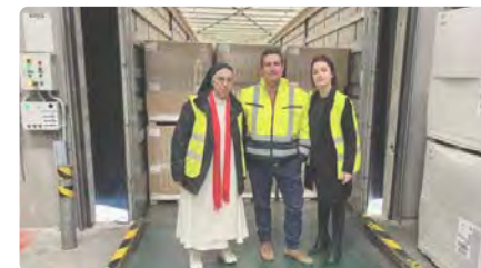
El govern d'Ucraïna agraeix l'ajuda humanitària de la Fundació del Convent de Santa Clara DV, 13/01/2023 | REGIÓ 7