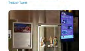
17:00 · 07 dic. 22 · Twitter Web App

CPL Editorial @CPLEditorial Tot preparat per celebrar el #Nadal en @SeminariBcn Encara sou a temps de posar el vostre granet de sorra per fer gran el pesebre 🙌 bit.ly/seminariibcn bit.ly/seminariibcn #SeminariSCB #Nadal2022