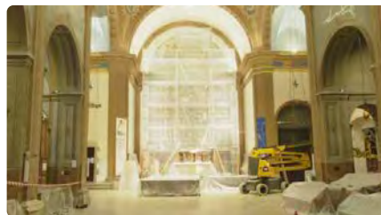
Rentat de cara a retaule i parets de l'església de la Geltrú DL, 05/12/2022