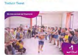
11:25 · 05 dic. 22 · Twitter Web App

Maristes Catalunya @MaristesCat Avui és el #DiaInternacionalVoluntariat i volem donar les gràcies a totes les persones que dediquen part del seu temps als altres, sense esperar res a canvi, i ho fan amb un somriure de cor. I tu... vols fer voluntariat? maristes.cat/voluntariat #somriudecor