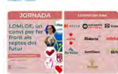
Jesuites Educació y 8 más 18:25 · 07 dic. 22 · Metricool

👉 Marti Codolar 👉 fecc.cat/jornada-lomloe