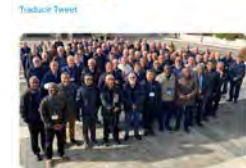
16:36 · 07 dic. 22 · Twitter Web App

Claretians de Sant Pau @claretiansCAT El Papa valora el viatge sinodal dels missioners claretians bit.ly/3Y6ULAI