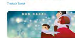
16:10 · 07 dic. 22 · Hootsuite Inc.

Fundació Pere Tarrés @Fundperetarres Des de la @Fundperetarres us volem desitjar un feliç #Nadal, que un any més celebrarem amb la mirada posada en la millora de les condicions de vida dels infants. Bon #Nadal2022!!