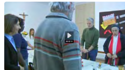
Un convent mixt a Manresa, l'escenari de convivència entre monges i laics DV, 09/12/2022 | TV3