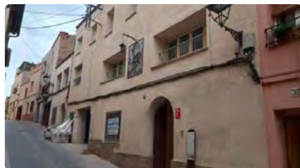
L'Ajuntament d'Olesa reforma l'antic convent de les Paüles per fer habitatge d'emergència social DL, 05/12/2022 | REGIÓ 7