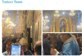
13:31 · 08 dic. 22 · Twitter for iPhone

Obs Blanquerna @ObsBlanquerna Hem estat a @concepcio_bcn en el dia de la festa de la Immaculada Concepció #Puríssima. El nunci apostòlic ha presidit.