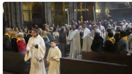
La Moreneta ja té una capella a la Catedral de Girona DV, 09/12/2022 | DIARI DE GIRONA