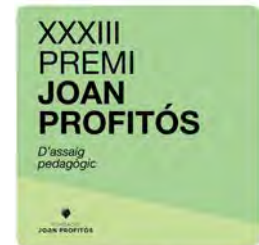
16:45 · 07 dic. 22 · Metricool

Jesuites Educació @JesuitesEdu Ja tenim el #pessebre aquí! Com cada curs, personal de serveis generals de #JEClot i la Comunitat Cristiana Sant Pere Claver col·laboren per muntar el pessebre a la recepció. I amb aquesta imatge, aprofitem per desitjar-vos uns feliços dies de descans. Ens retrobem dilluns! 🙌