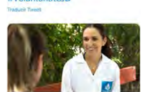
sjd.es Cada vez más mujeres de entre 18-25 años se suman al voluntariado | San Juan de Dios

Sant Joan de Déu CAT @OHSantJoandeDeu Temps, energia i motivació. Cada vegada hi ha més persones joves compromeses que volen col·laborar altruïstament per aconseguir una societat més justa. Uneix-te a la causa! #VoluntariatSJD