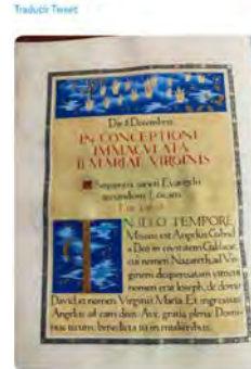
10:54 · 08 dic. 22 · Hootsuite Inc.

Abadia de Montserrat @monsantatinfo Bona festa de la Immaculada Concepció de la Mare de Déu. Imatge d'un evangeliari festiu de #Montserrat.