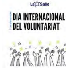
8:53 · 05 dic. 22 · Twitter Web App

LaSalleCat @LaSalleCat #LaSalle #TreballantPerUnMónMillor