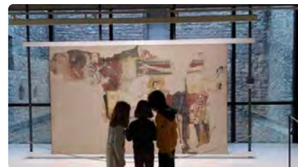
El Museu Diocesà d'Urgell activa un pla d'actes virtuals diaris durant l'Advent DT, 06/12/2022 | REGIÓ 7