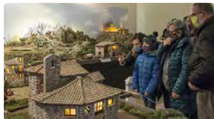
Montserrat protagonitzarà el pessebre monumental de Manresa, el més gran que s'ha fet mai fins ara DJ, 08/12/2022 | REGIÓ 7