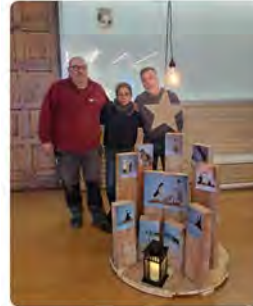
18:03 · 07 dic. 22 · Agorapulse app

Claretians de Sant Pau @claretiansCAT El Papa valora el viatge sinodal dels missioners claretians bit.ly/3Y6ULAI