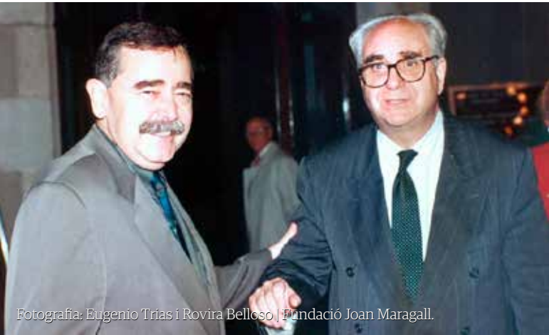
Fotografia: Eugenio Trias i Rovira Belloso | Fundació Joan Maragall.