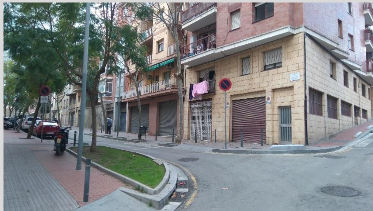
Façana del local vist des del carrer Antoni Gilabert i Bonet

Llavors, després de moltes negatives per part de propietaris de locals en lloguer, a finals de 2014 van trobar un local que en un principi complia tots els requisits i on el propietari estava disposat a llogar-los el local. El local en qüestió està ubicat en uns baixos amb dues entrades que dona sortida als carrers Gòngora i Antoni Gilabert i Bonet. Compta amb uns 150 m 2 i segons l'arquitecte consultat eren uns locals molt adequats per l'ús que l'hi volien donar. En primeres instàncies van parlar amb Nou Barris Acull (una xarxa d'entitats quina funciona és, segons ens va explicar dues de les seves treballadores, "fer un treball acompanyat (...) treballar de manera coordinada amb tot el que té a veure amb la convivència, cohesió social, acollida, diversitat.") que els hi va acompanyar en tot el procés. I en segon lloc amb l'Oficina d'Afers Religiosos.