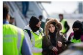
La policía detiene a la mujer que quería unirse al EI. ISIDRO J. GAVILAN LINARES