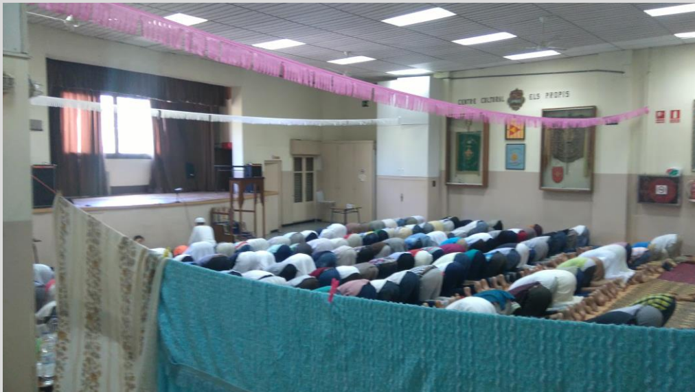
Pregària al local del Centre Cultural Els Propis

Mentrestant fan les pregàries del divendres, el jutba , en els locals de Els Propis, però estan en una situació encara més delicada ja que per part del Centre Cultural Els Propis, on fan les pregàries els divendres, sembla que comença a haver una mica de conflicte intern a la junta.