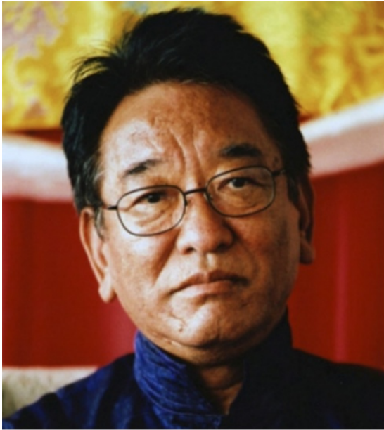
Tarab Tulku Rinpoche